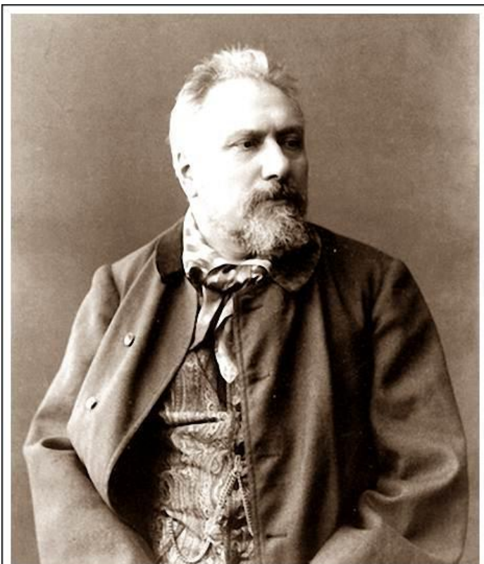
Николай Семёнович Лесков