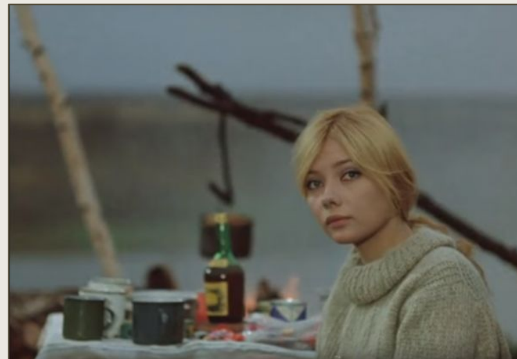
Кадр из кинофильма «Берег принцессы Люськи».