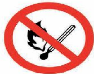
«Запрещается пользоваться открытым огнём и курить»

Обошлось без лишней фразы, Не читает он еще, Но рисунок понял сразу: «Проходить запрещено!»