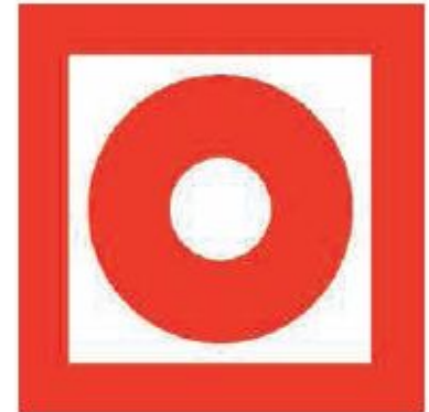
«Кнопка включения установок пожарной автоматики»

Автоматика способна, (Если кнопку ту нажать) И сигнал поднять «Тревога!», И водой поливать.