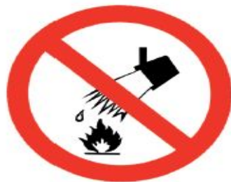
«Запрещается тушить водой»

Есть фонарь? Свети – не жалко, Но с огнем не подходи. Спрячь-ка, спички, зажигалку: Здесь зажжешь – и все сгорит!