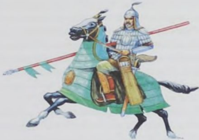
Воин-кыргыз (IX–X вв.).

В 842 году, после приезда в столицу династии Тан военачальника Тапу Алп Сола в качестве посла кыргызского кагана, историки китайского императорского двора записали с его уст важные сведения. В 840–842 годах кыргызские войска вошли в пределы городов Куча (Аньси) и Беш-Балык (Бэйтин), точнее говоря, дошли до Восточного Тянь-Шаня, до низменности, расположенной по берегам реки Тарим. Более того, ими были покорены татарские племена в Монголии, которые исповедовали несторианство, но говорили по-тюркски. Кыргызы стремились контролировать также группу восточных уйгуров, которые перекочевали в Кара-Озен (Хэлочуань, позже переименованный в Эдзин-Гол).