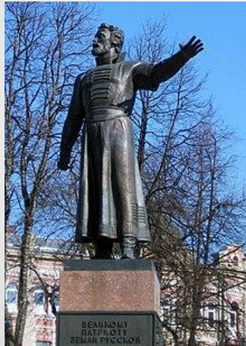
Памятник Минину в Нижнем Новгороде