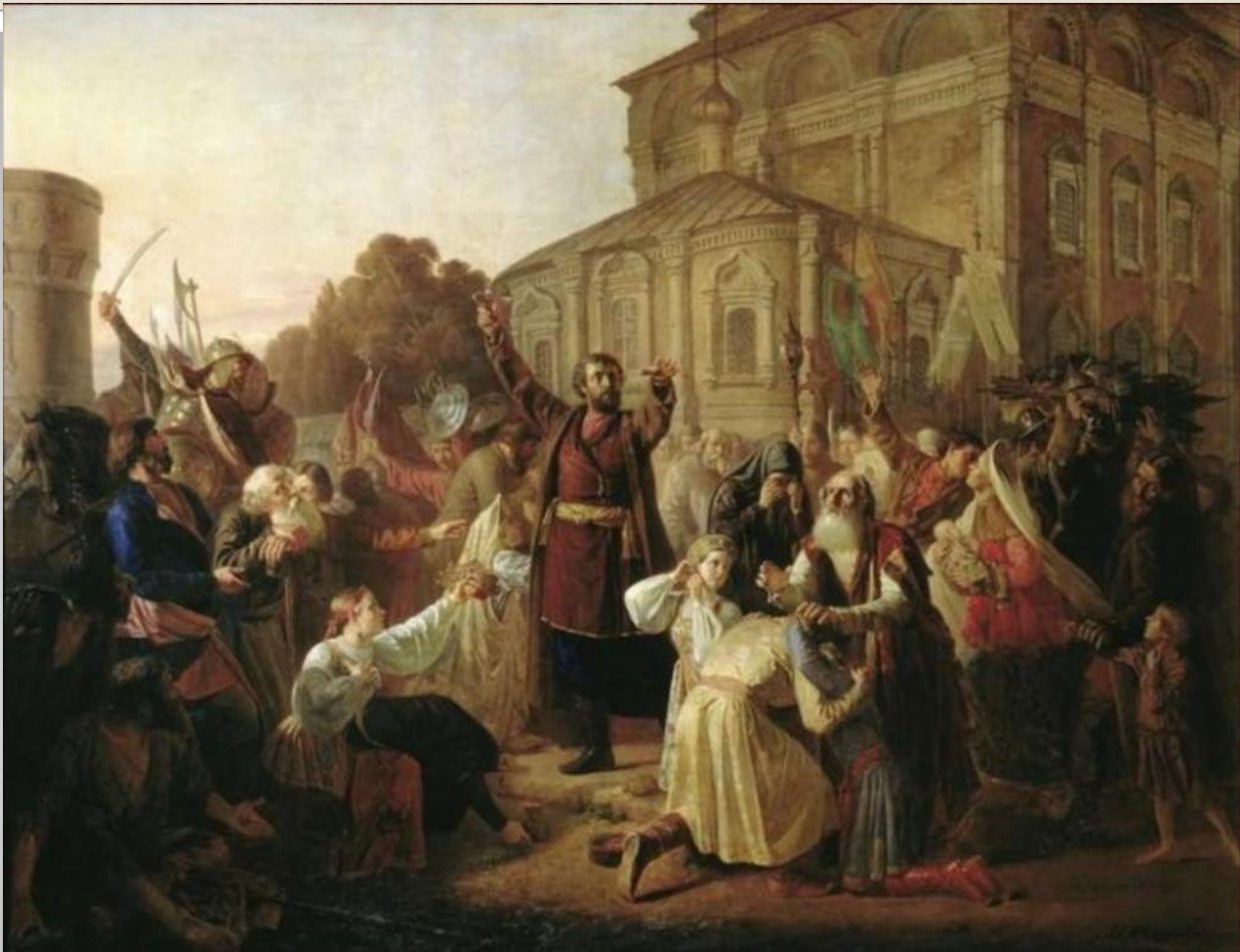
М.И.Песков «Воззвание Минина к нижегородцам в 1611 году» (1861г.)