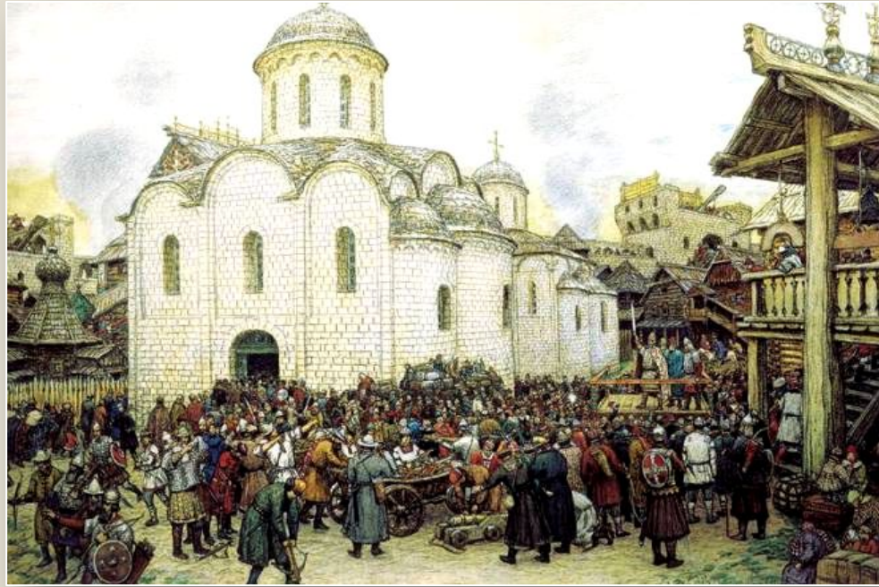
А.М. Васнецов «Оборона Москвы от хана Тохтамыша»

Используя историческую картину А.М. Васнецова, отрывок из труда историка Н.И. Костомарова, составьте рассказ на тему «Оборона Москвы от хана Тохтамыша». В своём рассказе объясните, почему Русь смогла одержать победу в Куликовской битве и не смогла отстоять Москву через 2 года, как повлияли события, о которых вы рассказали, на дальнейшее развитие Руси, отношения Руси и Золотой Орды.