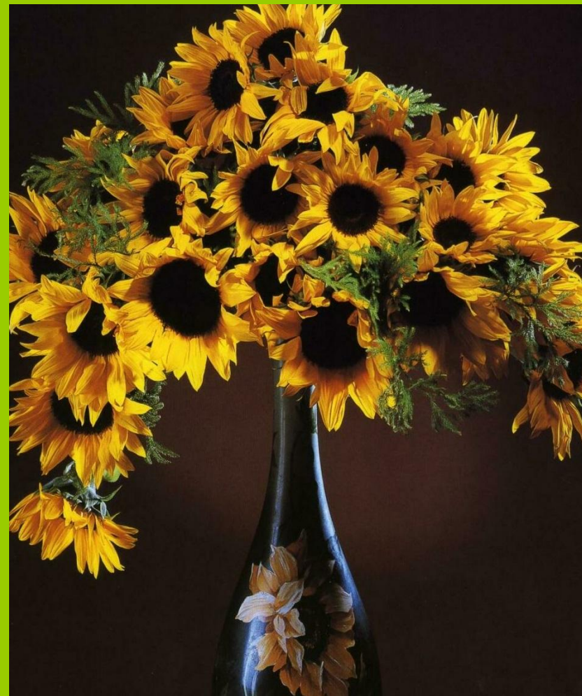
Цветочная композиция «Подсолнухи»