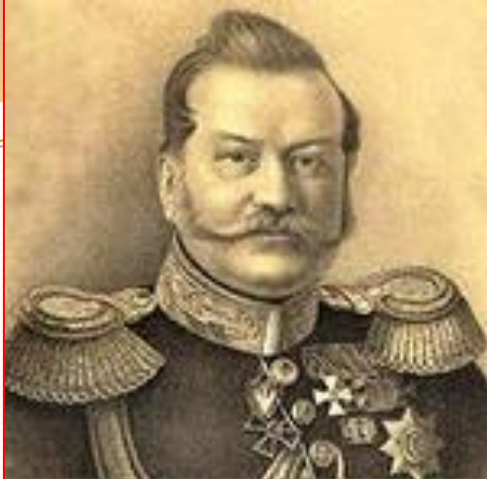
Ростовцев Яков (Иаков) Иванович [28.12.1803— 6(18).2.1860, там же], граф, русский государственный и военный деятель