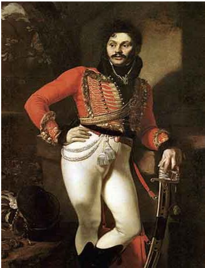
О. Кипренский. Портрет Е.В. Давыдова