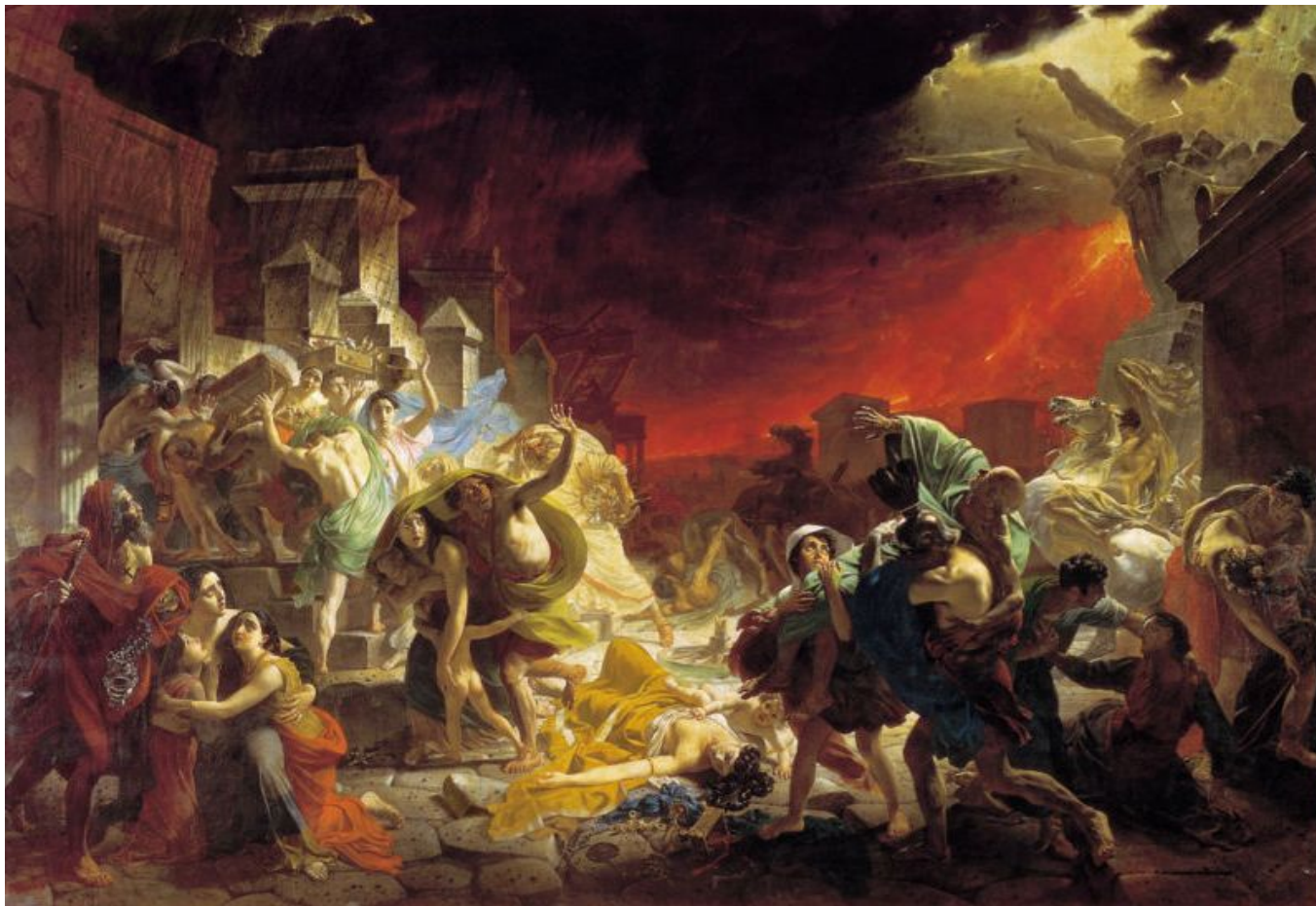
К. Брюллов. «Последний день Помпеи»