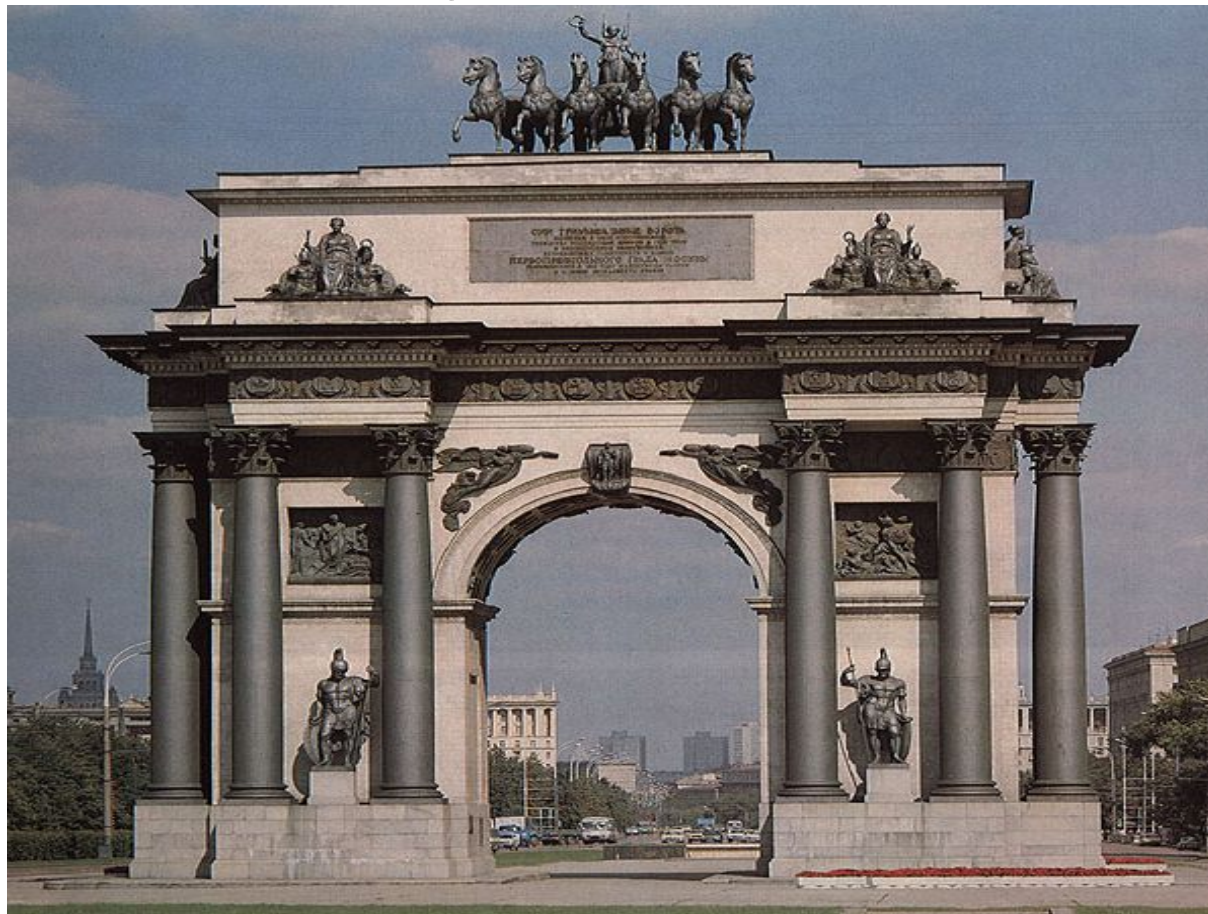
О. Бове. Триумфальная арка