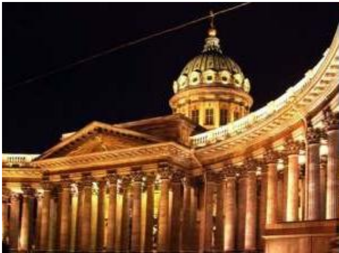
А.Н. Воронихин. Казанский собор