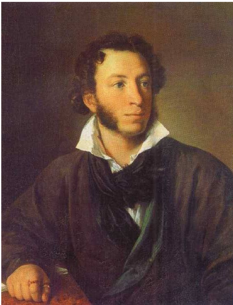
В.А. Тропинин. «Портрет А.С. Пушкина»