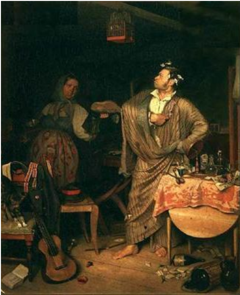
П.А. Федотов. «Свежий кавалер»