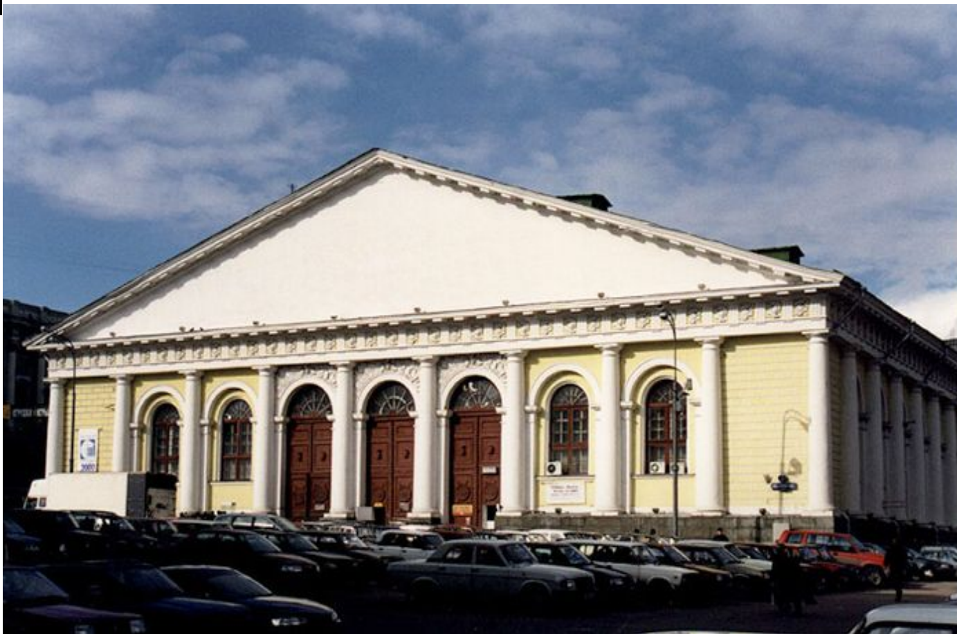
О. Бове. Манеж