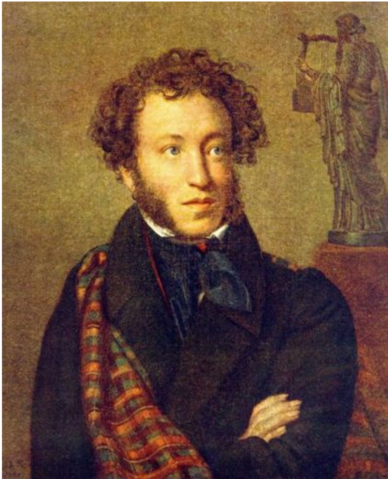
О. Кипренский. Портрет А.С. Пушкина