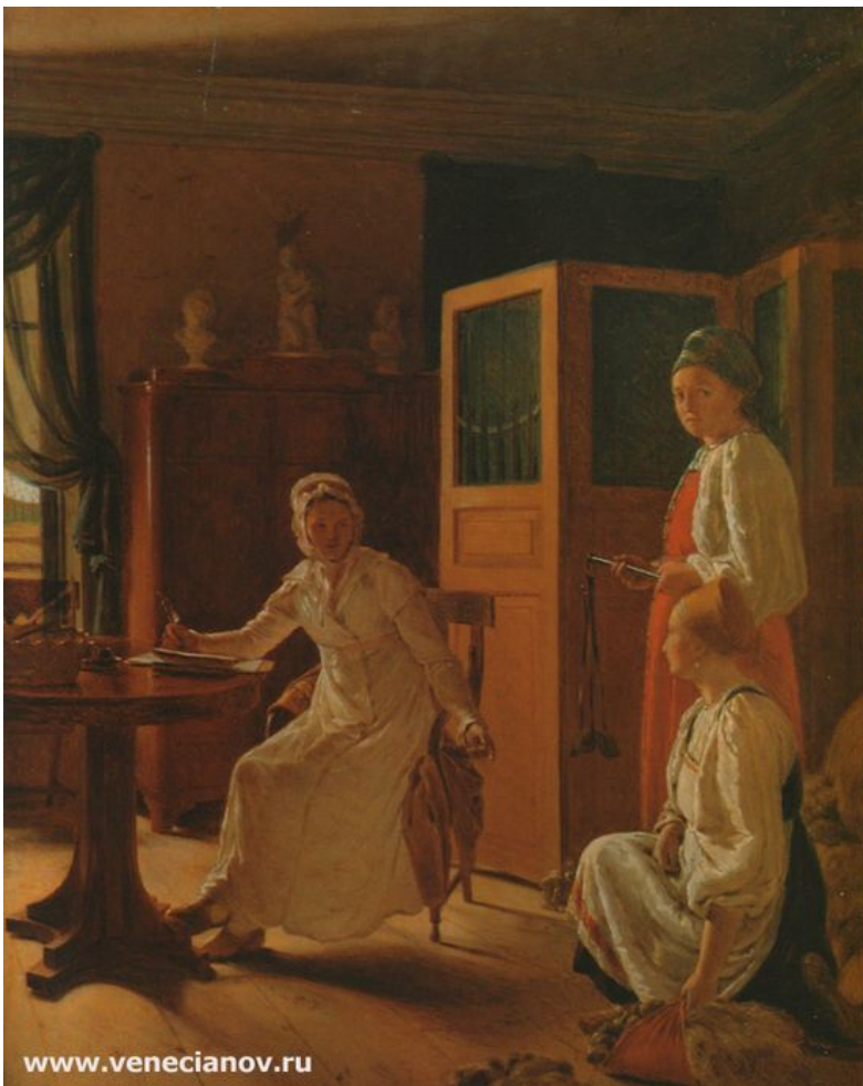
А.Г. Венецианов «Утро помещицы»