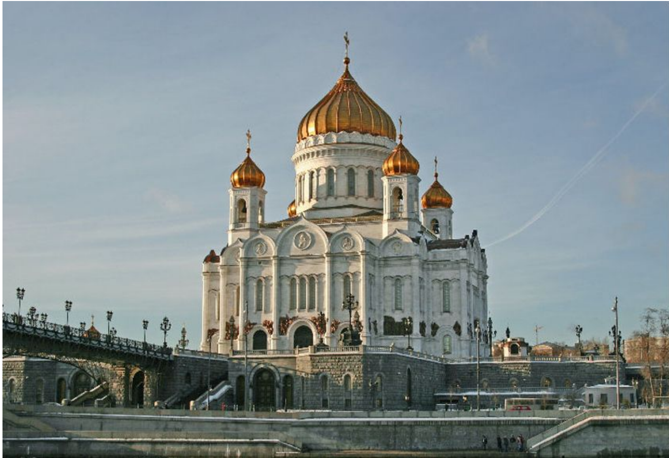
К.А. Тон. Храм Христа Спасителя Русско-византийский стиль