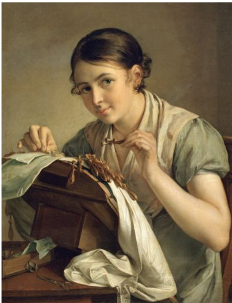
В.А. Тропинин. «Кружевница»