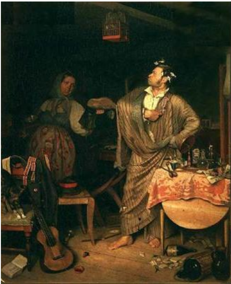
П.А. Федотов. «Свежий кавалер»