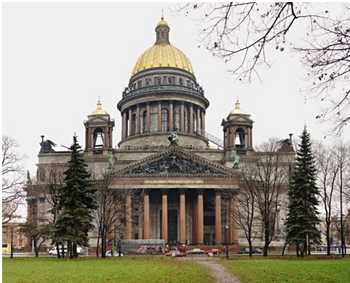
О. Монферран. Исаакиевский собор