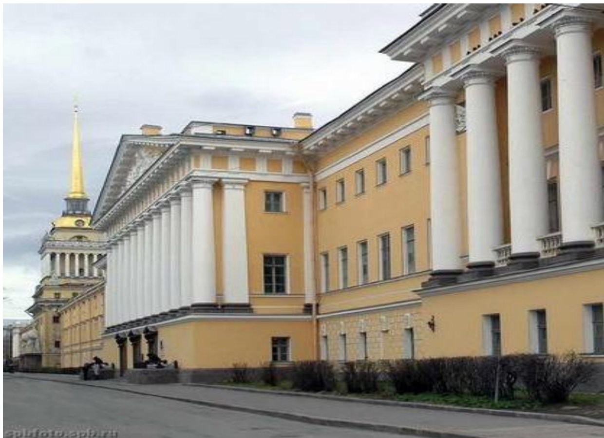
А.Д. Захаров. Адмиралтейство