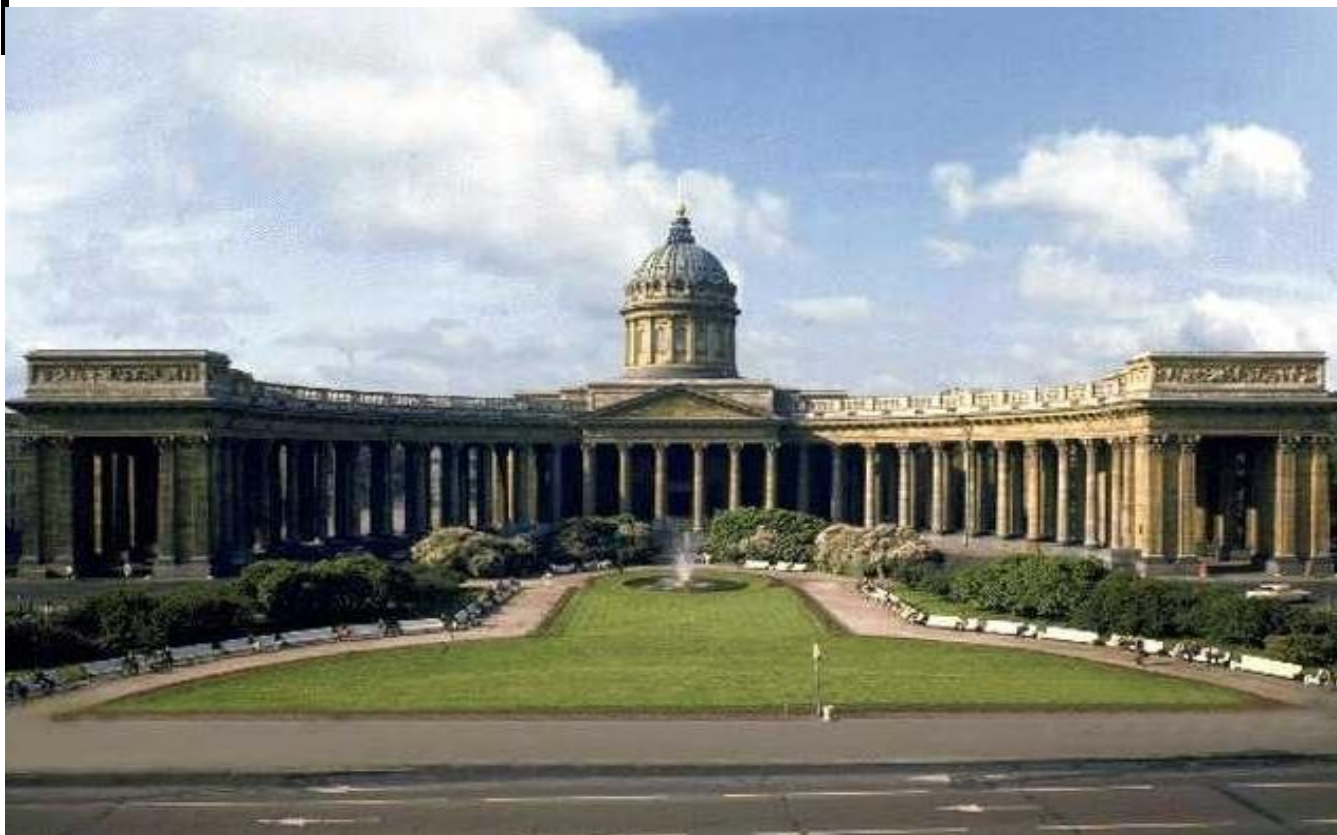
А.Н. Воронихин. Казанский собор