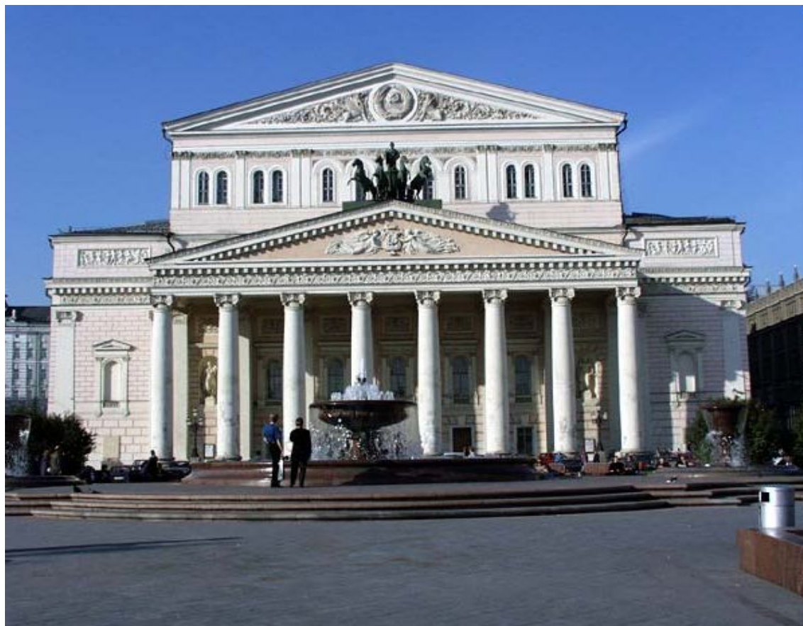
О. Бове. Большой театр