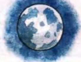
the Moon Луна