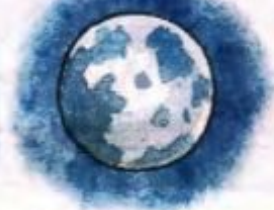
the Moon Луна