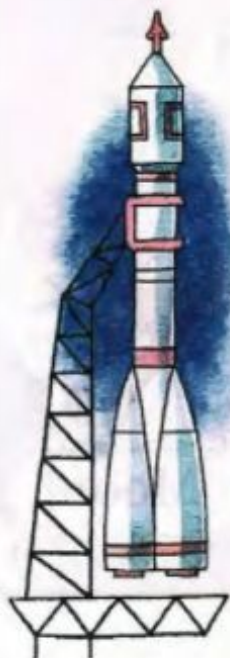
a rocket ракета