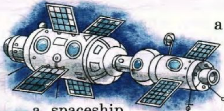
a spaceship космический корабль