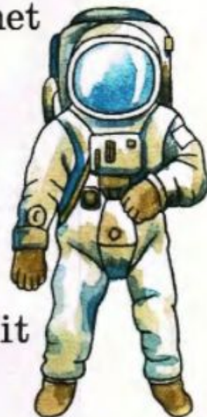
a spacesuit скафандр