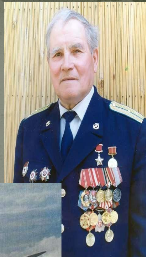
Девятаев Михаил Петрович

гвардии старший лейтенант, лётчик- истребитель. Совершил побег из немецкого концлагеря на угнанном бомбардировщике.