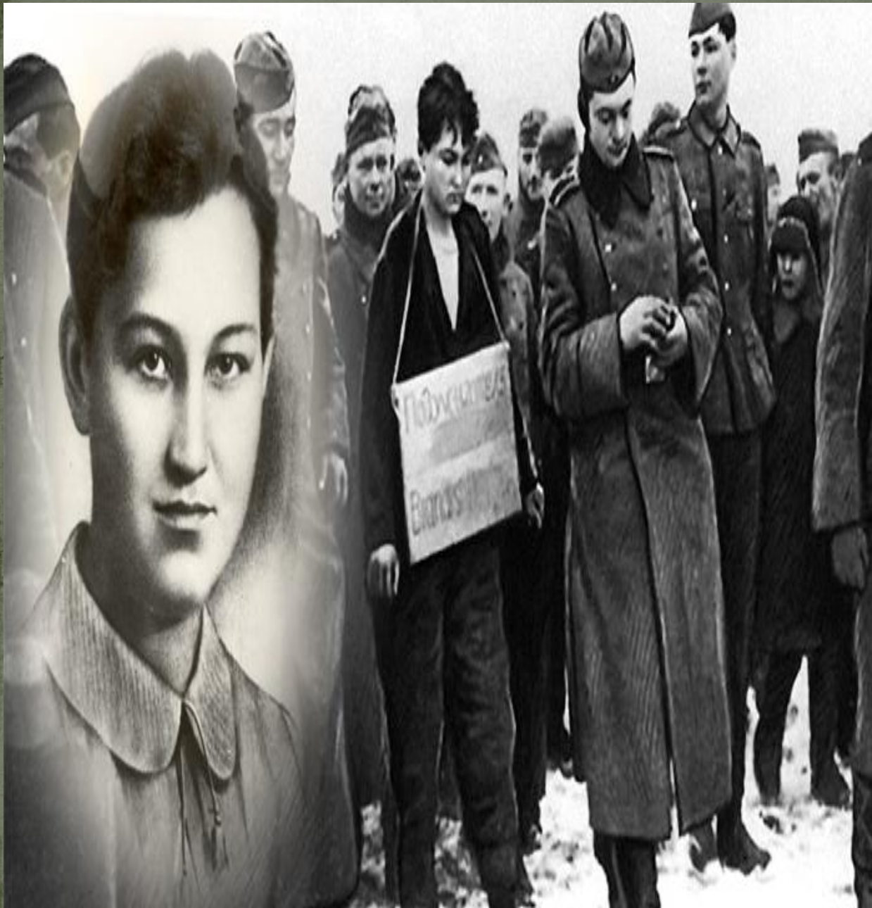
Зоя Космодемья нская Анатольевна