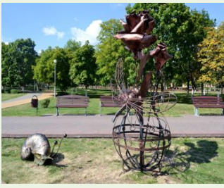
Стихия земли. Арт-объект «Роза и улитка»

Предложите ребенку игру с природным материалом «Цветочная мозаика» (на песке с помощью различного материала создать цветочную композицию). Поиграйте с ребенком в игру-пантомиму «Живая клумба». (Дети-«цветы» выполняют различные движения: распускаются, качаются от сильного ветра, закрывают вечером лепестки). Прочитайте ребенку сказку Г.Х. Андерсена «Улитка и розы».