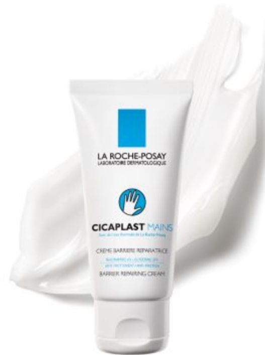
ЦИКАПЛАСТ РУКИ Бар'єрний відновлюючий крем