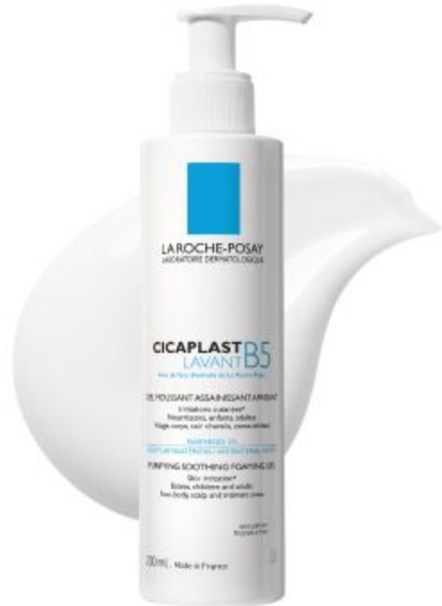
ЦИКАПЛАСТ Б5 Очищающий гель