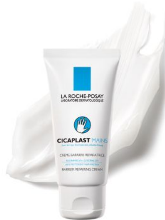
ЦИКАПЛАСТ РУКИ Барьерный восстанавливающий крем