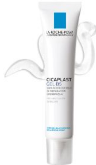
ЦИКАПЛАСТ ГЕЛЬ Б5 Гель для ускоренной регенерации