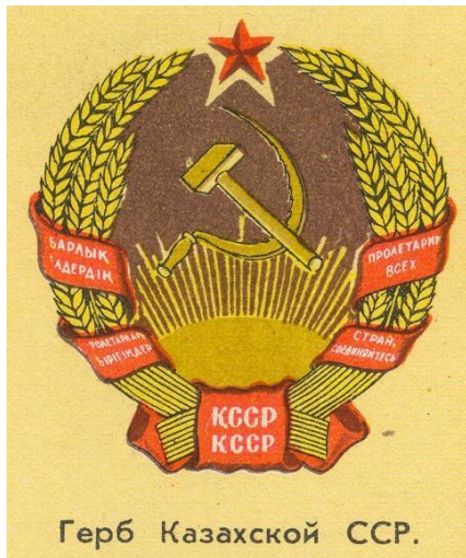
Герб Казахской ССР.