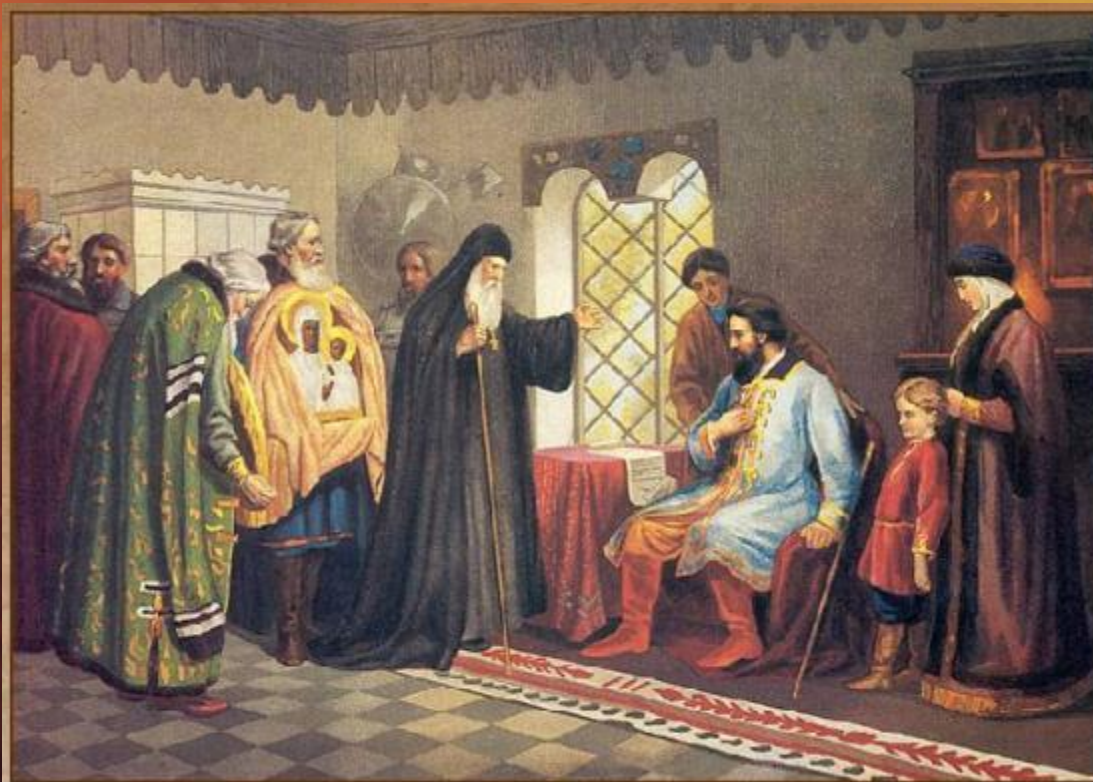
Нижегородские послы у князя Дмитрия Пожарского. 1611 г.