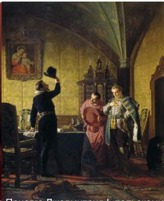
Н. Неврев Присяга Лжедмитрия I польскому королю Сигизмунду III на введение в России католицизма.

Он тайно перешел в католическую веру, пообещал ввести в России католицизм, королю Сигизмунду III отдать Черниговские земли, а воеводе Мнишеку – Псков, Новгород, другие земли.