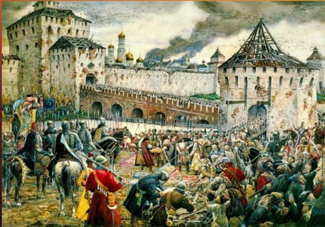
Э.Лисснер. Изгнание польских интервентов из Московского Кремля в 1612 г