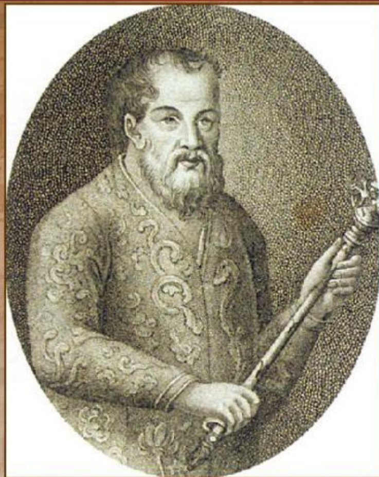
Пожарский Д.М., князь, глава Ямского приказа

Минин Кузьма Захарьевич, по прозванию Сухорук