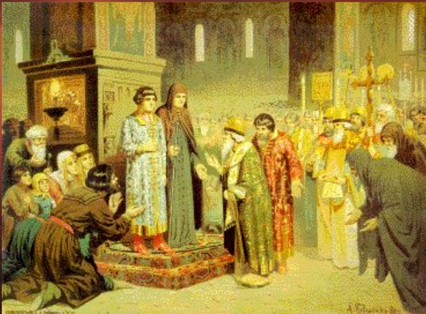
Призвание Михаила Романова на царство.