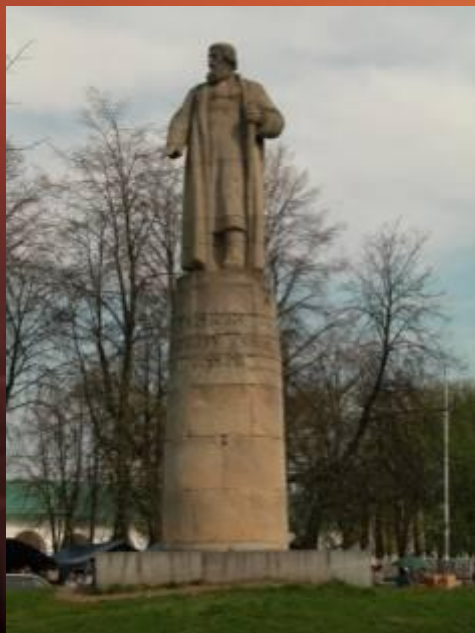
ИВАН СУСАНИН – костромской крестьянин, спасший царя.

Символом верности Родине вечно служит подвиг костромского крестьянина Ивана Сусанина, пожертвовавшего собственной жизнью в борьбе против польских интервентов, заведшего врагов в глухой лес, в болото. По преданию, таким образом, он спас жившего тогда в Костроме выбранного на царство Михаила Фёдоровича Романова