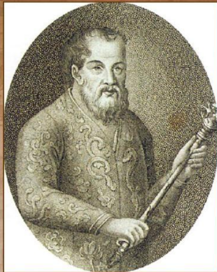
Пожарский Д.М., князь, глава Ямского приказа

Минин Кузьма Захарьевич, по прозванию Сухорук