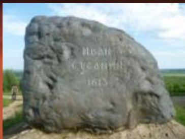
Памятный камень на месте подвига Ивана Сусанина.