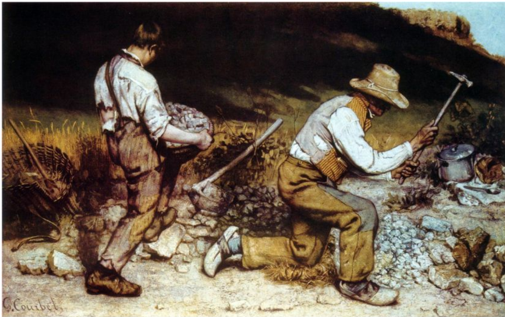
Гюстав Курбе «Дробильщики камня», 1849 г.