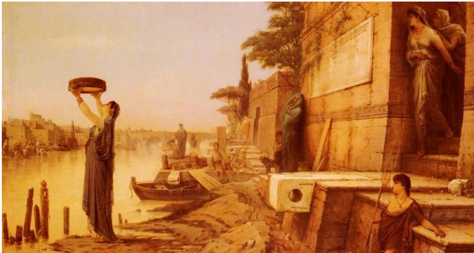
Луи Гектор Леру «Весталка Тучча»