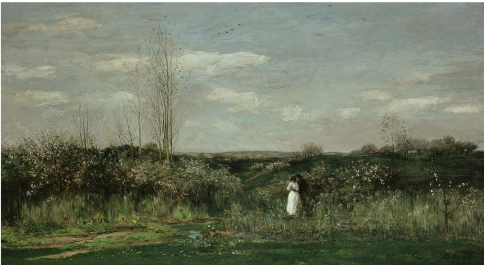
Шарль Франсуа Добиньи «Весна», 1862 г.