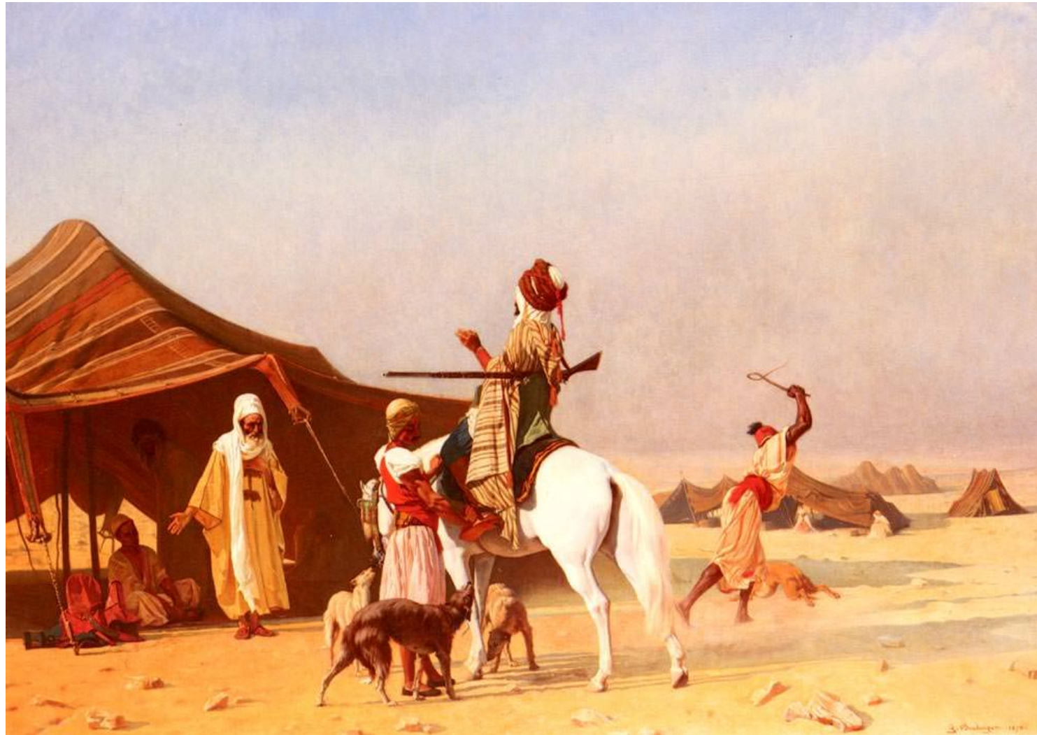
Гюстав Буланже Кларен Родольф «Это эмир»