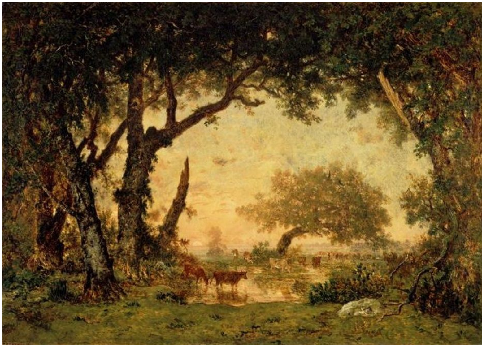
Теодор Руссо «Выход из леса Фонтенбло»