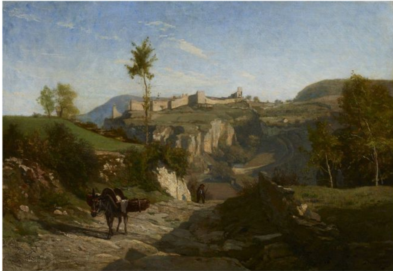
Шарль Франсуа Добиньи «Пейзаж близ Кремьё», 1849 г.