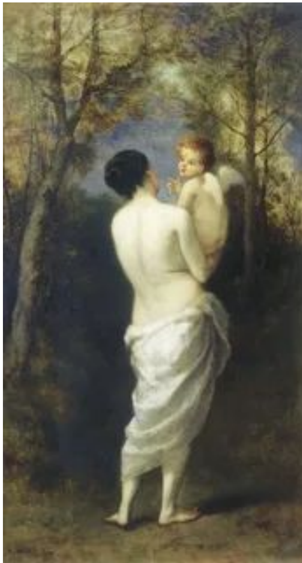
Нарсис Диаз «Венера, с Амуром на руках»