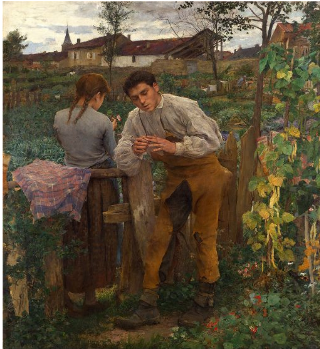
Жюль Бастьен-Лепаж «Деревенская любовь», 1882 г.