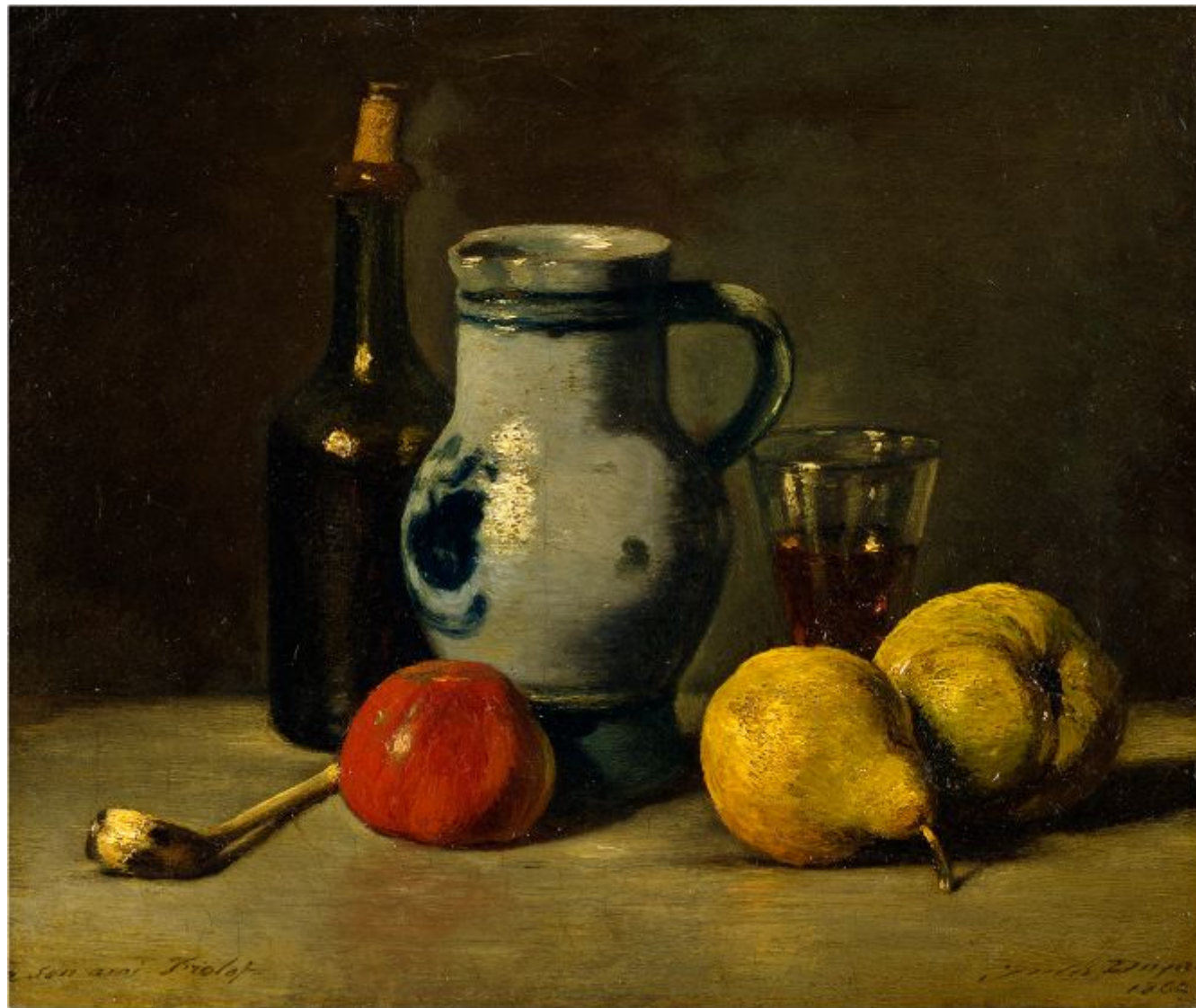
Жюль Дюпре «Натюрморт с кувшином», 1862 г.