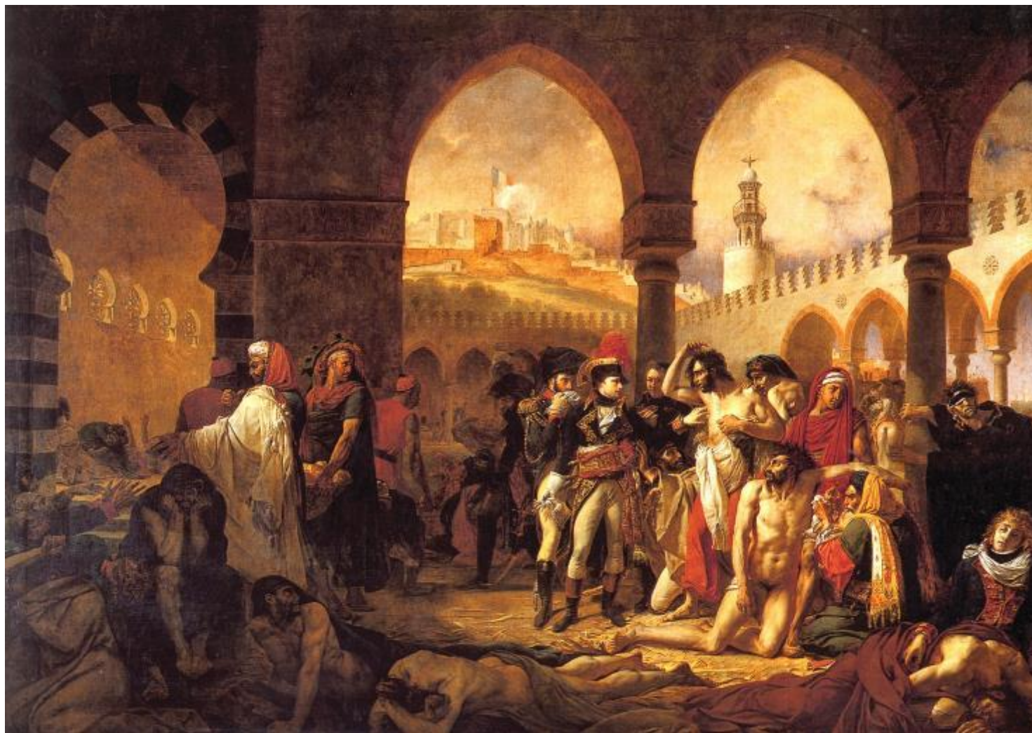
Антуан-Жан Гро «Наполеон посещает чумный барак в Яффо» 1841