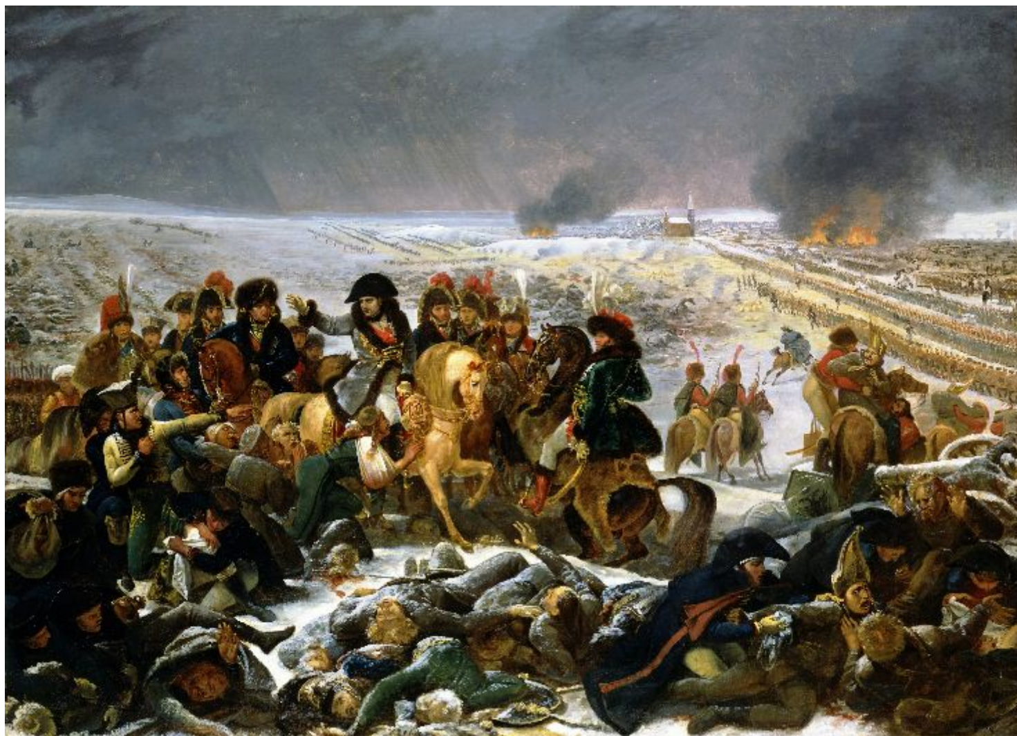
Антуан-Жан Гро «Наполеон на поле битвы при Эйлау» 1807 год