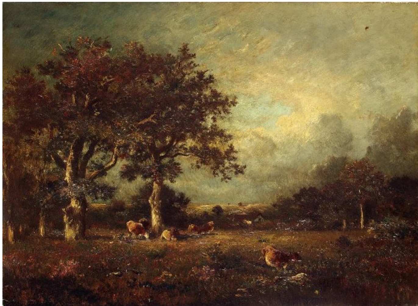
Жюль Дюпре – «Пейзаж с коровами»