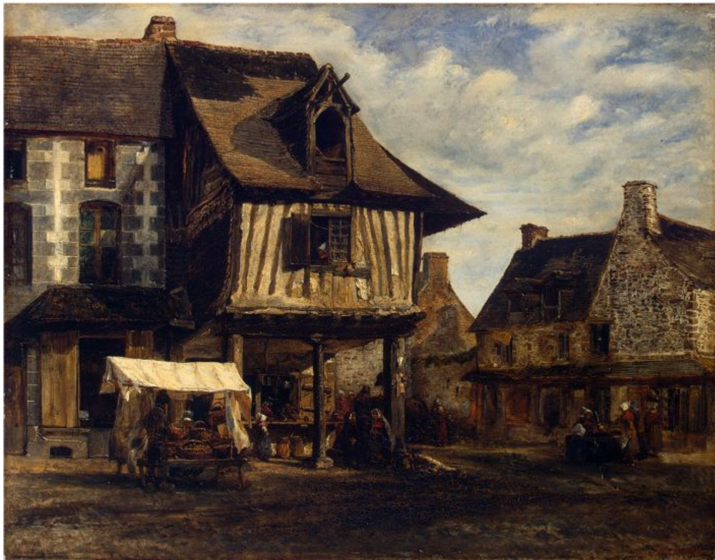
Теодор Руссо «Рынок в Нормандии», 1830-е гг.