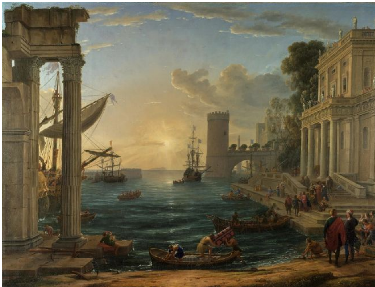
Клод Лоррен «Отплытие царицы Савской», 1648