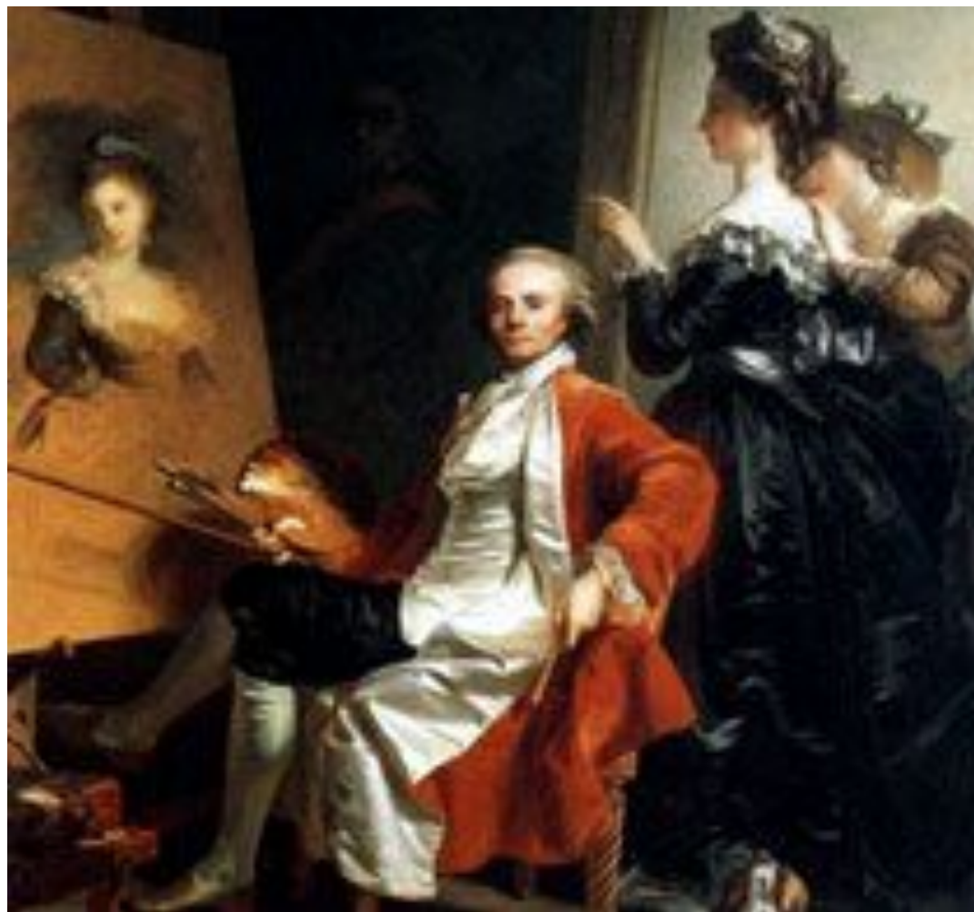
Монье Жан-Лоран «Автопортрет художника в студии» 1786