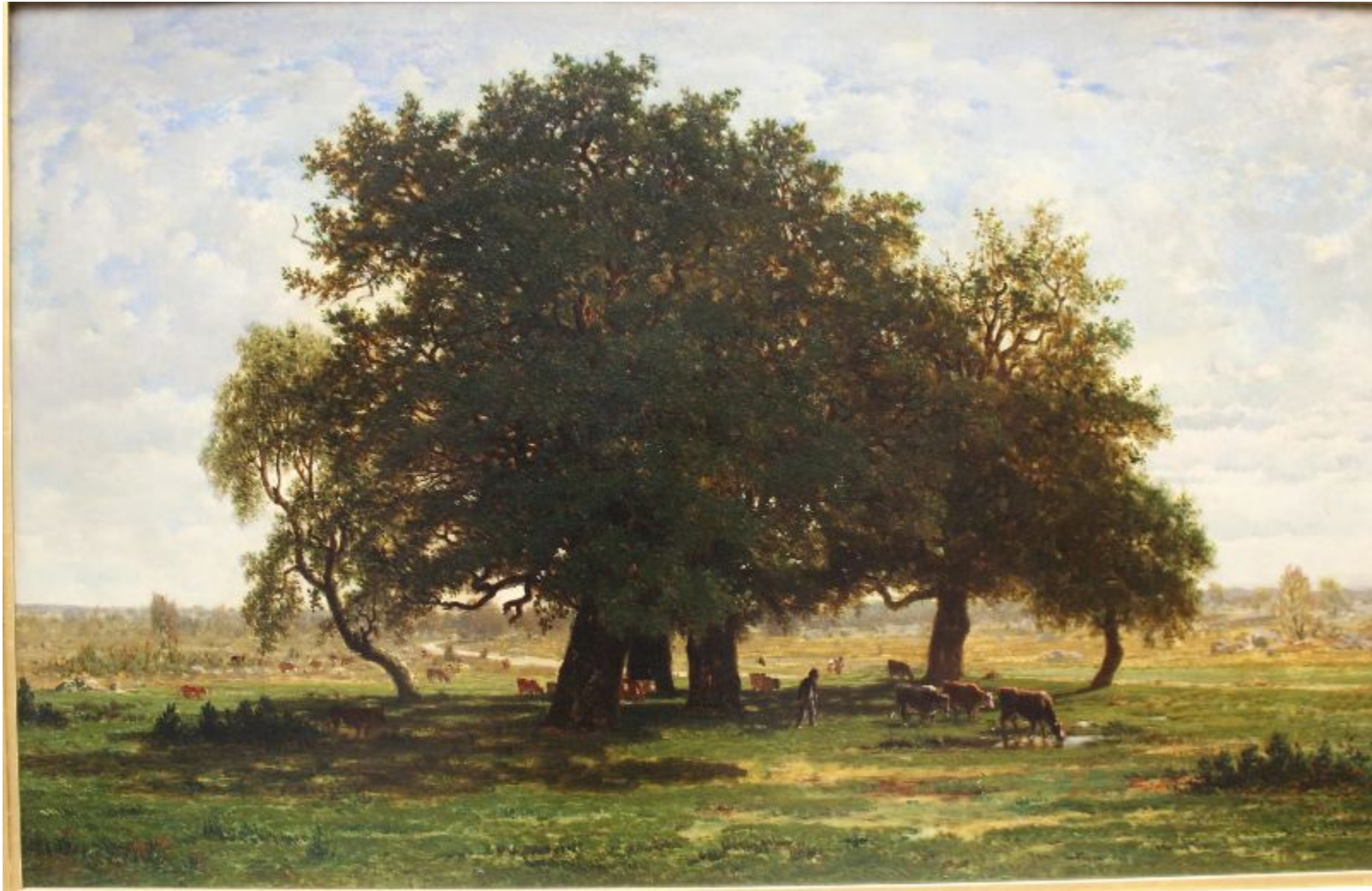
Теодор Руссо - "Дубы в лесу Фонтенбло" 1855