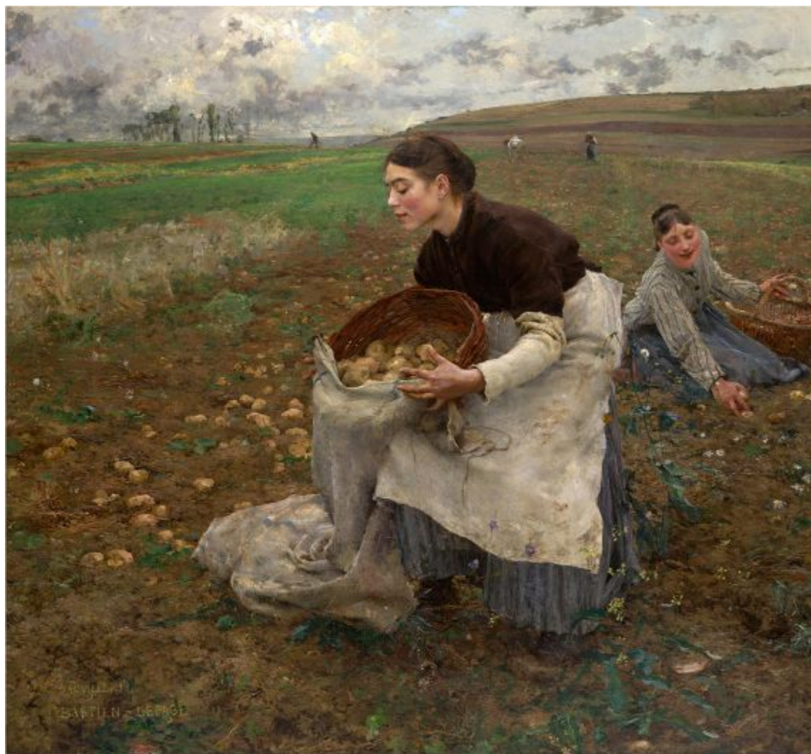
Жюль Бастьен-Лепаж «Октябрь. Сбор картофеля», 1878 г.