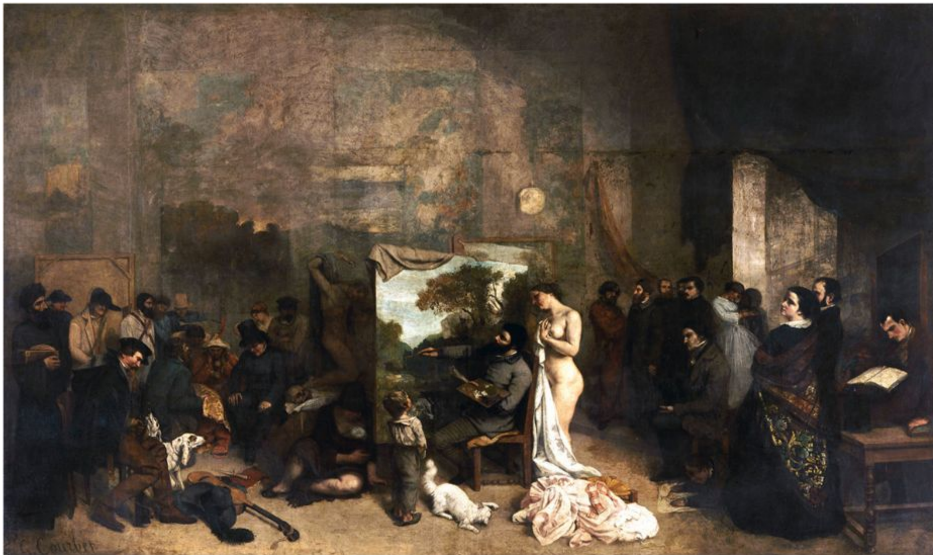
Гюстав Курбе «Мастерская художника», 1855 г.