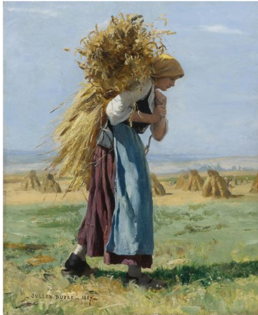
Жюльен Дюпре "В полях", 1887 г.