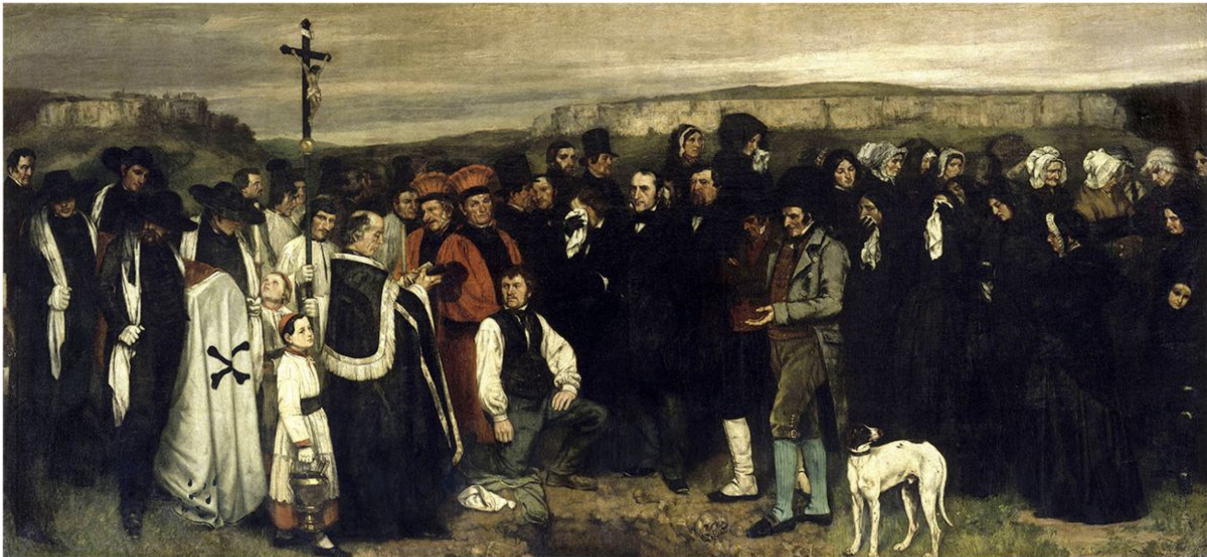
Гюстав Курбе «Похороны в Орнани», 1850 г.