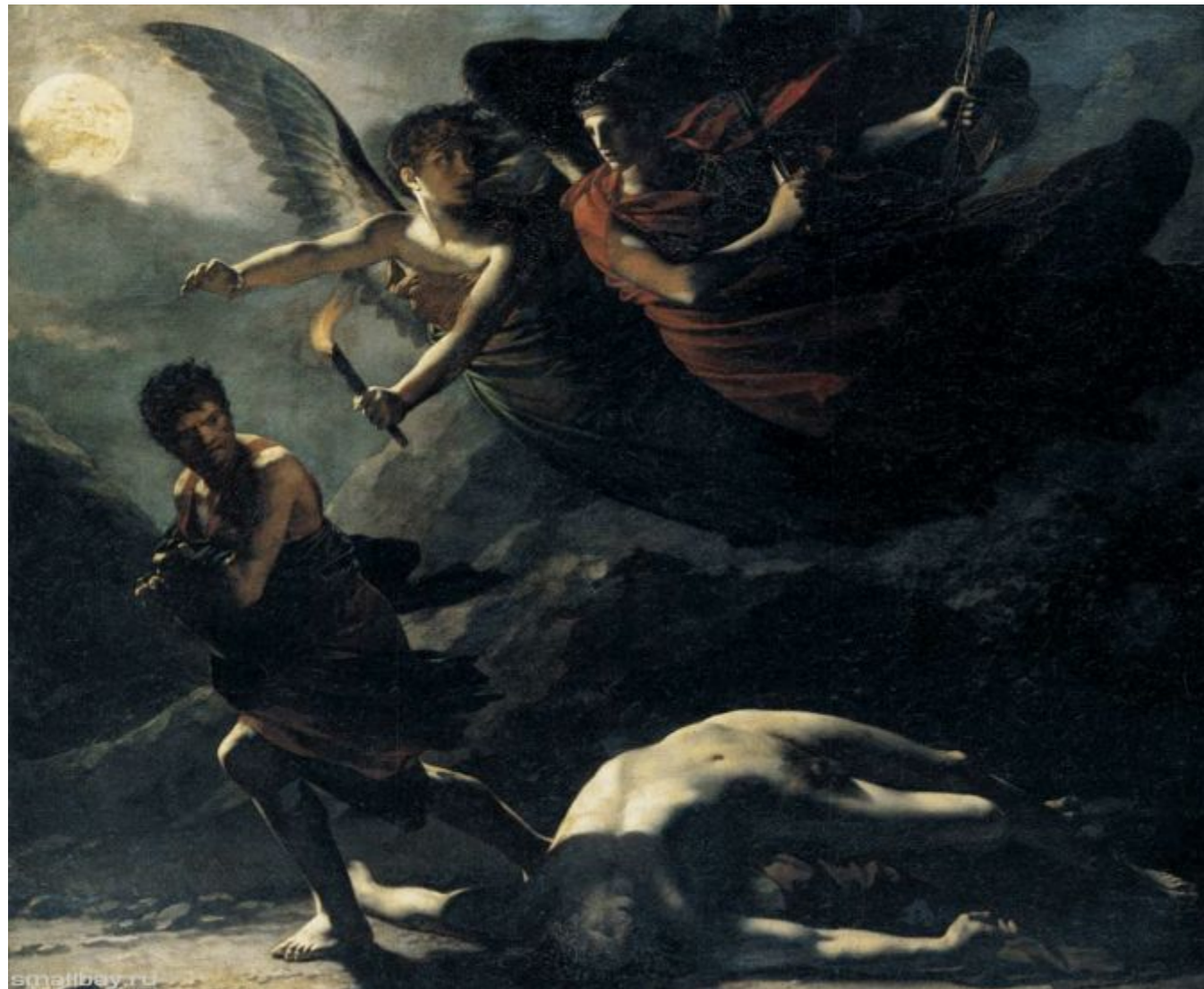
Прюдон Пьер Поль «Преступление, преследуемое Правосудием и Мщением» 1808