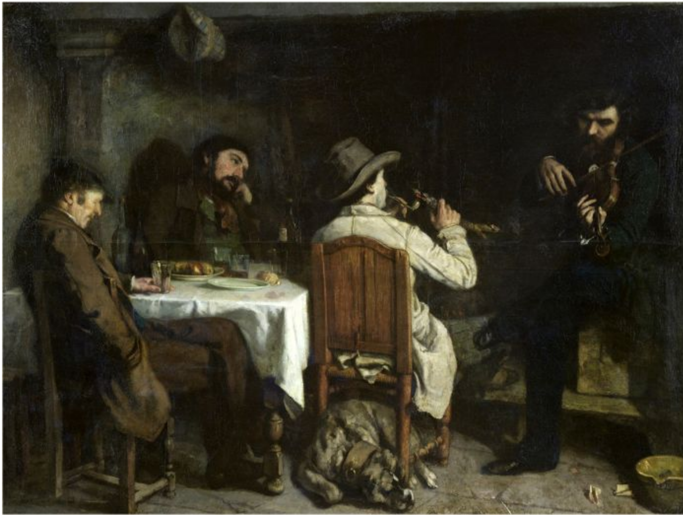
Гюстав Курбе «Послеобеденный отдых в Орнани», 1849 г.