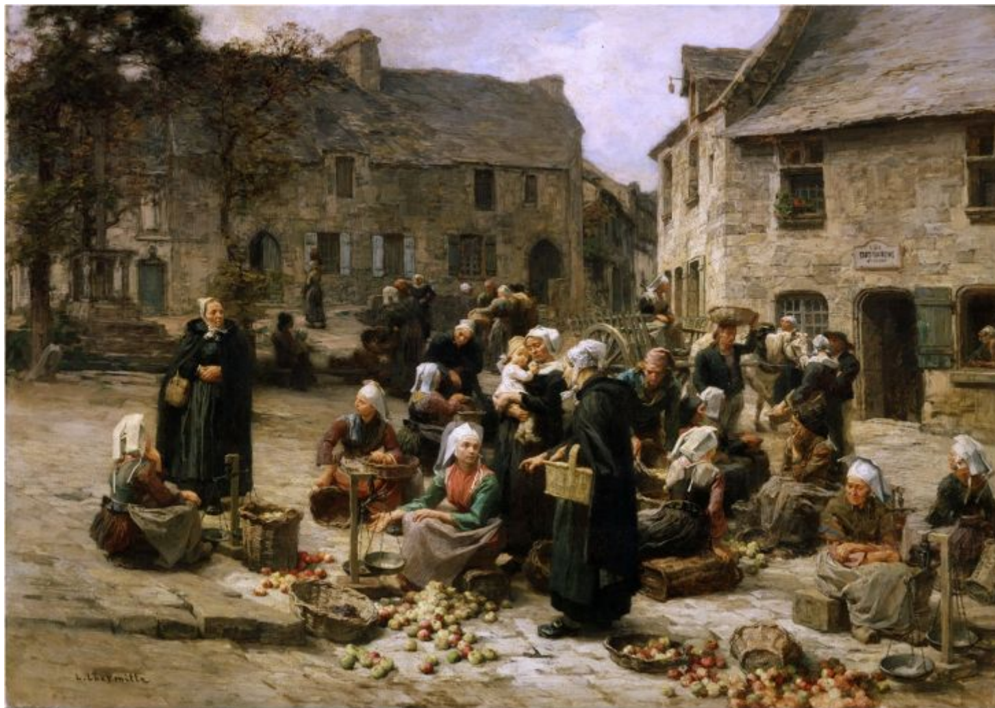
Леон Огюстен Лермитт «Яблочный рынок в Ландерно, Бретань», 1878 г.