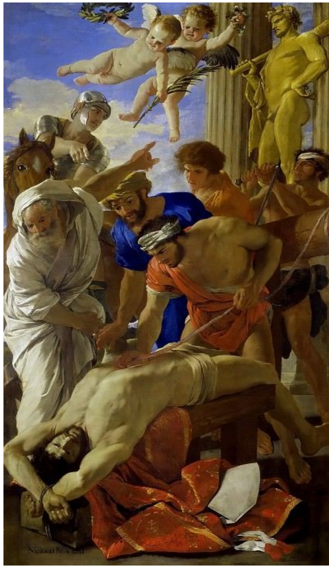
Никола Пуссен «Мученичество святого Эразма»