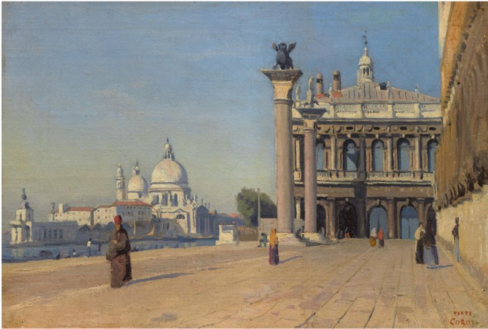
Жан Батист Камиль Коро "Утро в Венеции", 1834 г.