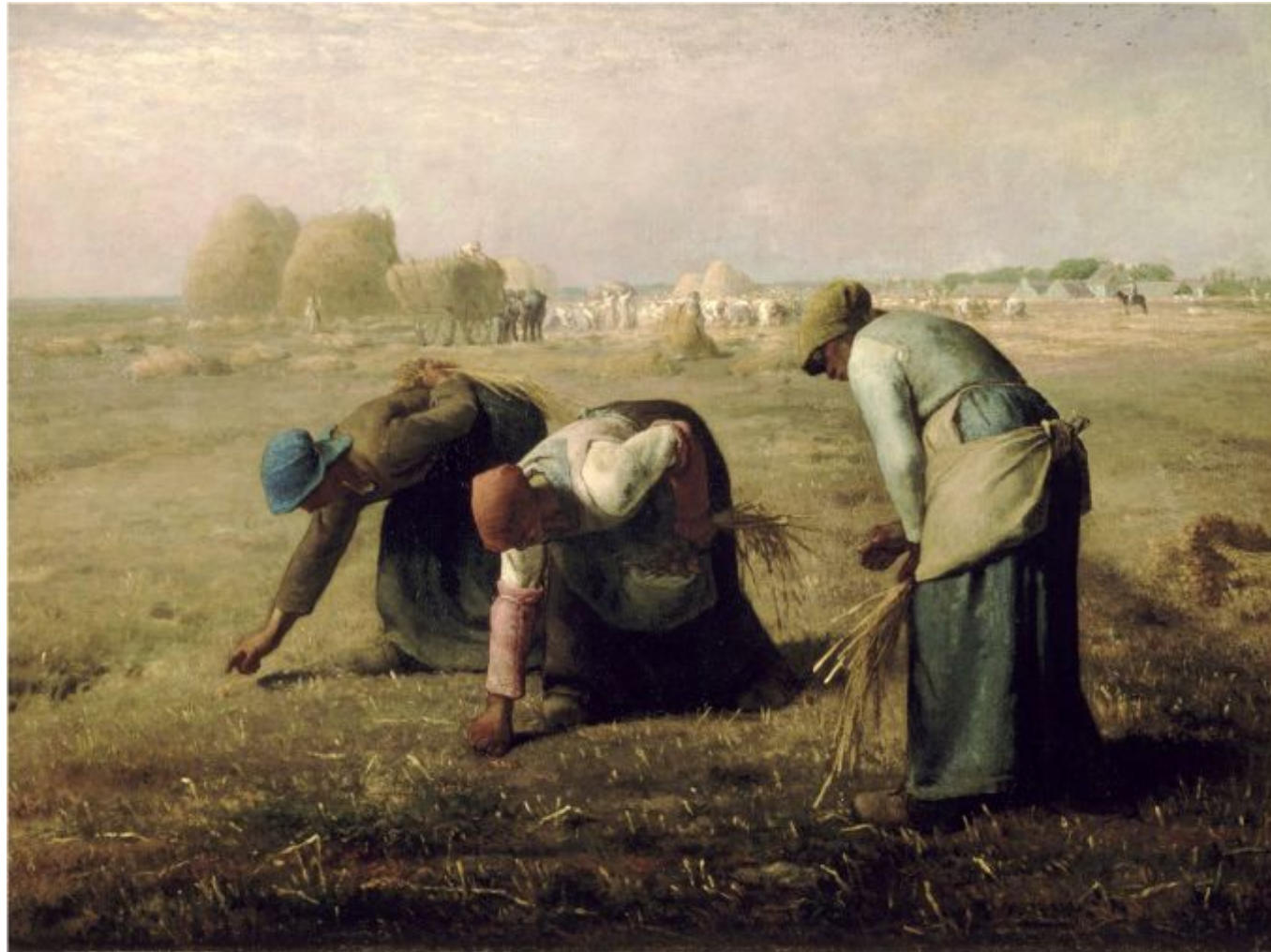
Жан Франсуа Милле «Сборщицы колосьев», 1857 г.