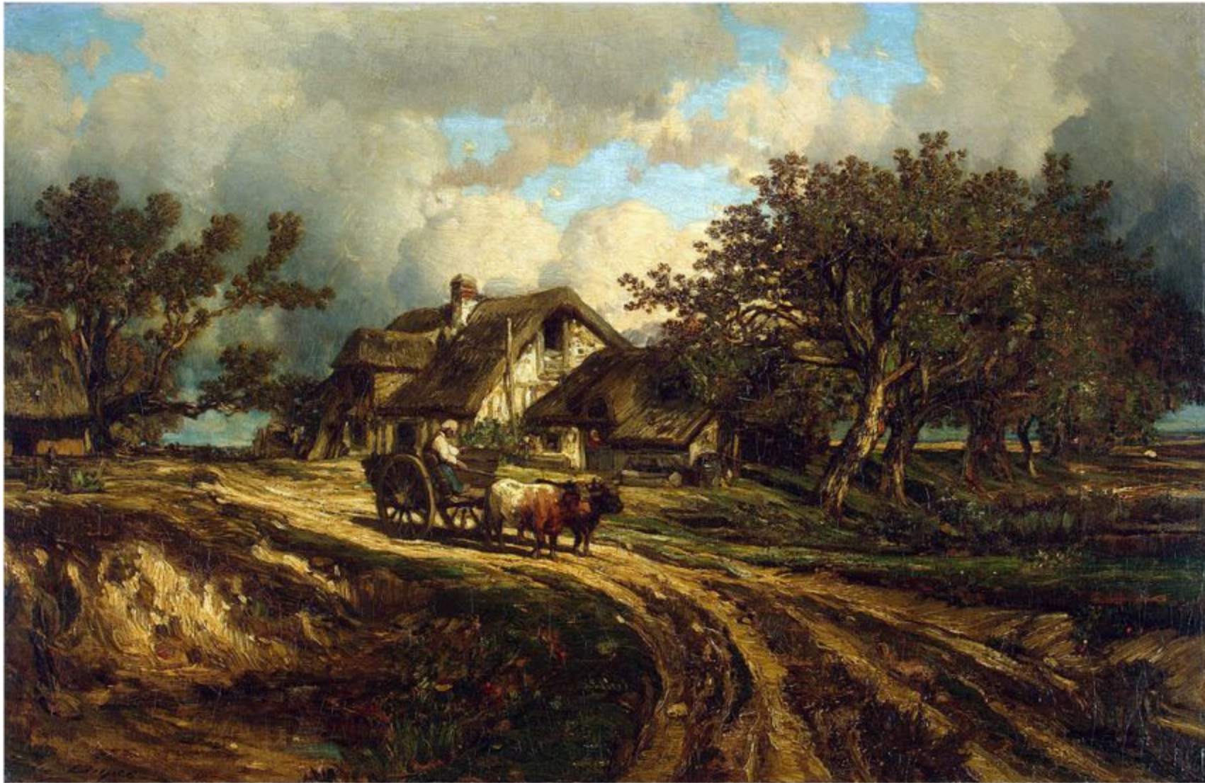
Жюль Дюпре «Деревенский пейзаж», 1840-е гг.