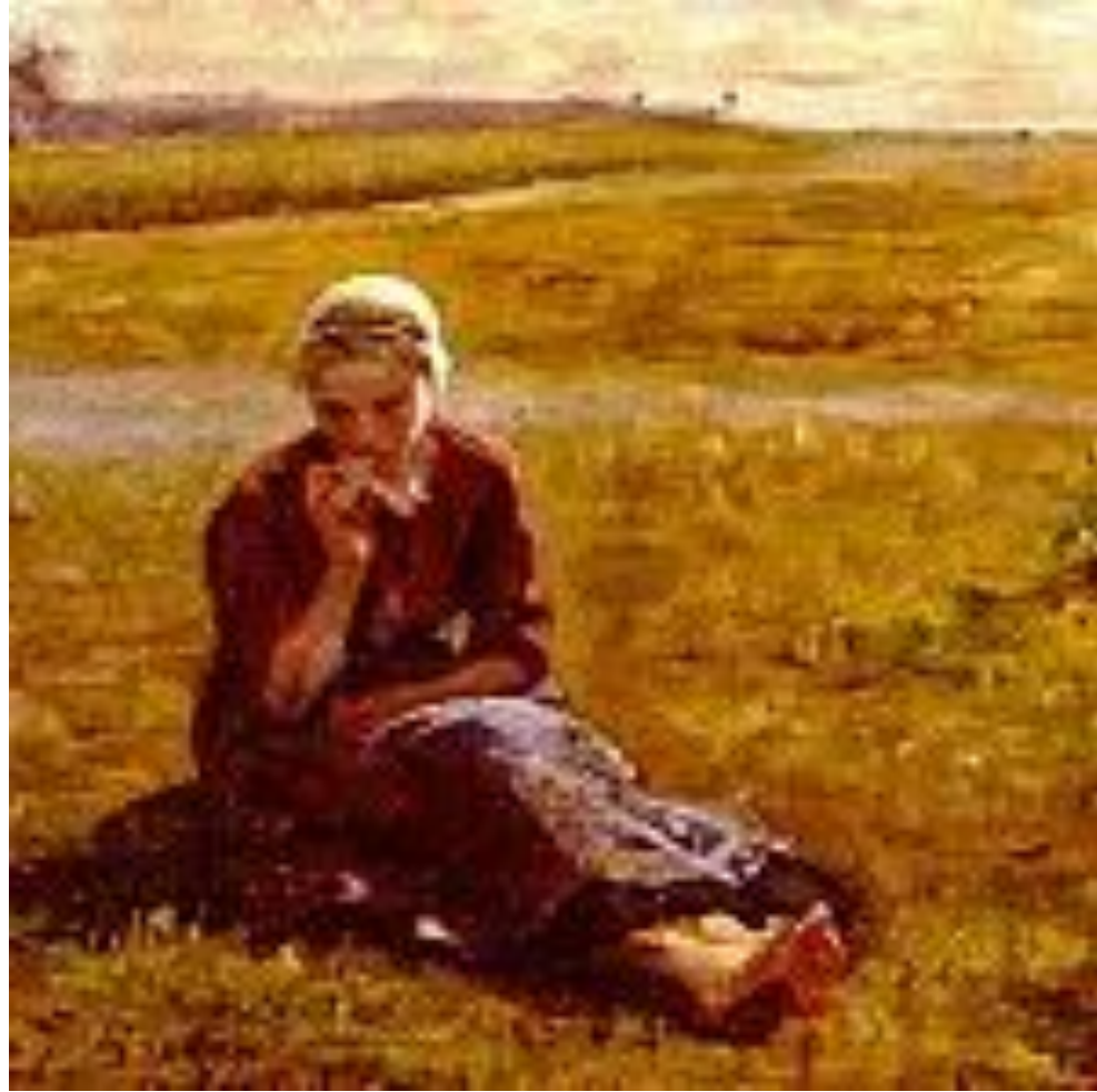
Жюль Бретон «Послеполуденная трапеза»