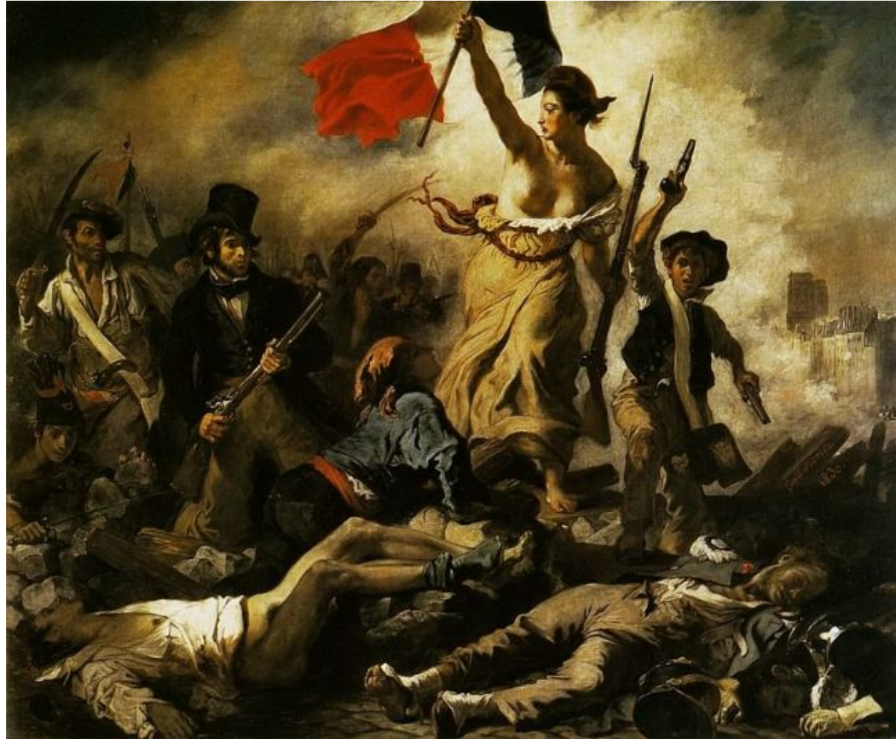
Эжен Делакруа «Свобода, ведущая народ» 28 июля 1830