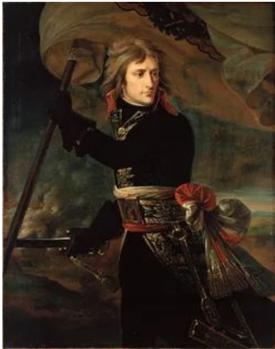
Антуан-Жан Гро «Бонапарт на Аркольском мосту» 1796