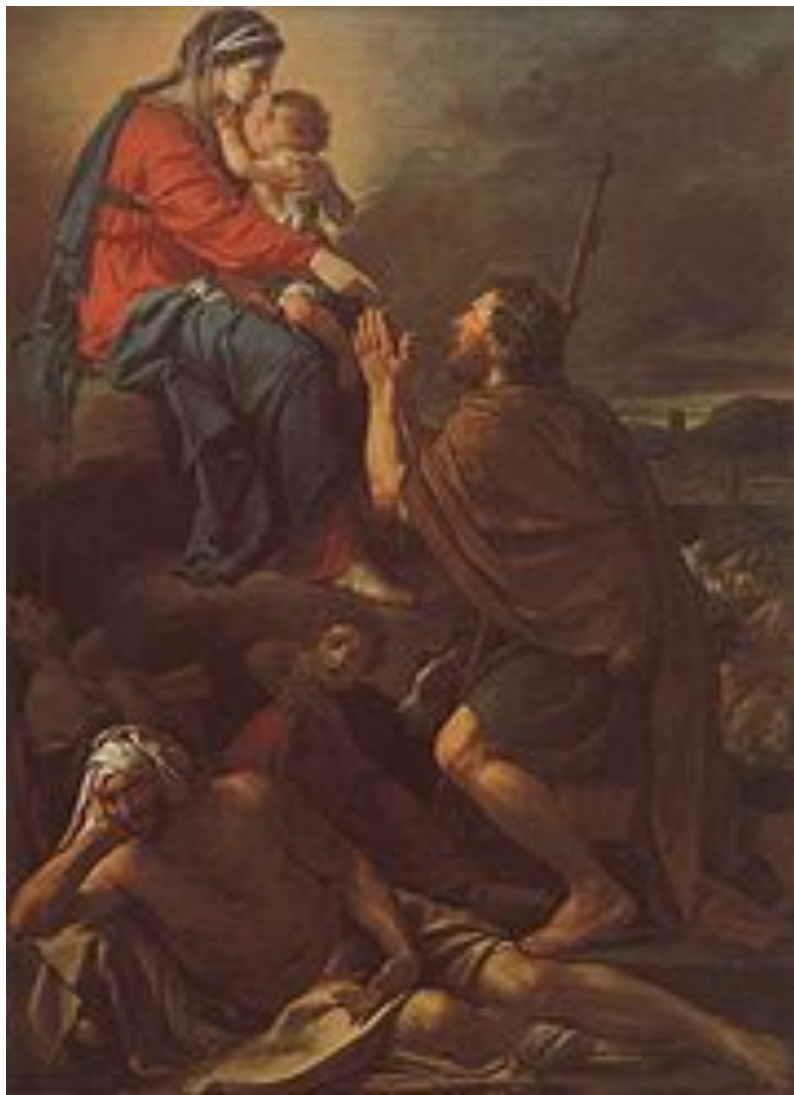
Жак Луи Давид «Святой Рох молится Мадонне об исцелении зачумлённых»