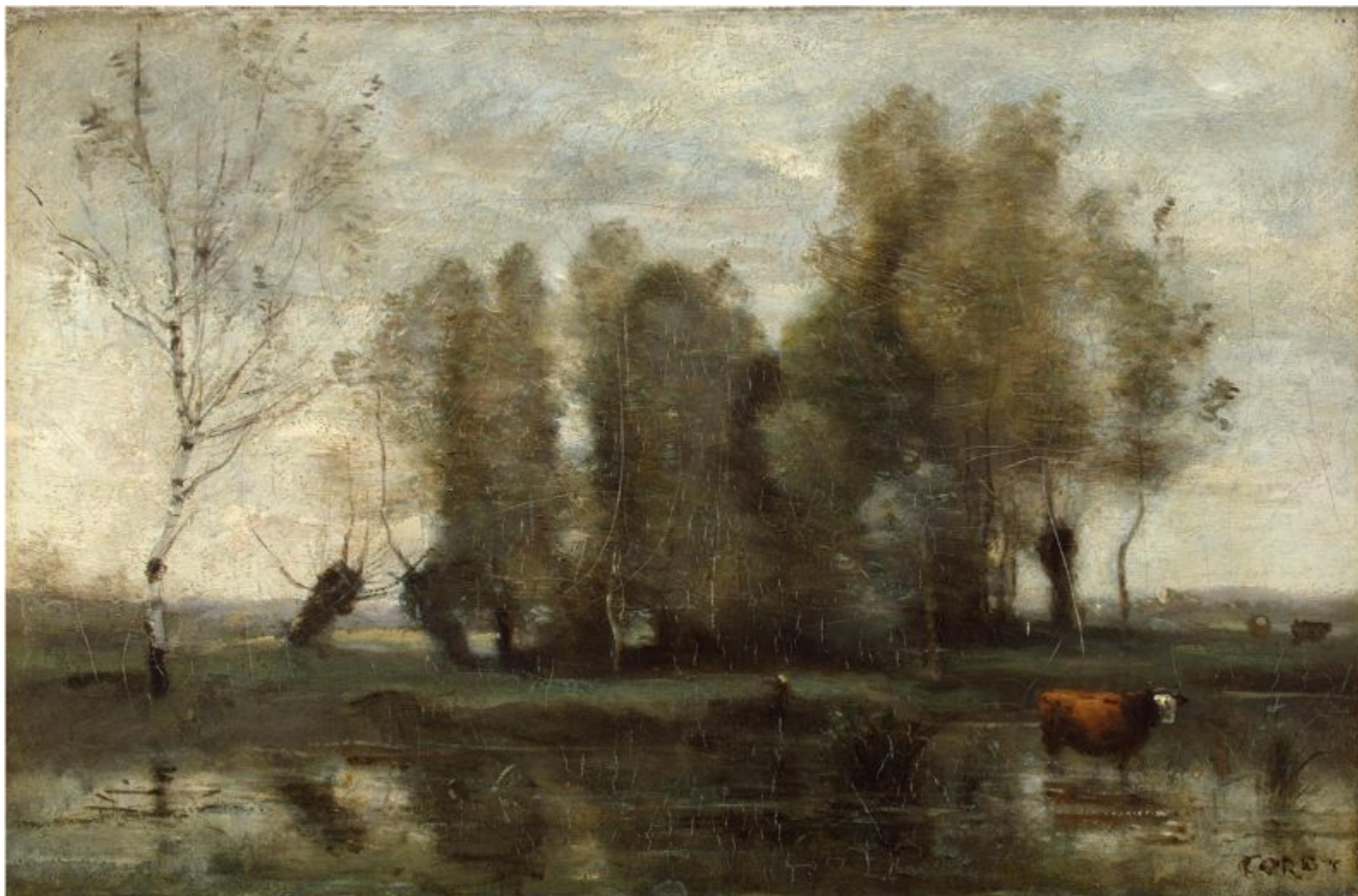
Жан Батист Камиль Коро «Деревья среди болота», 1860-е гг.