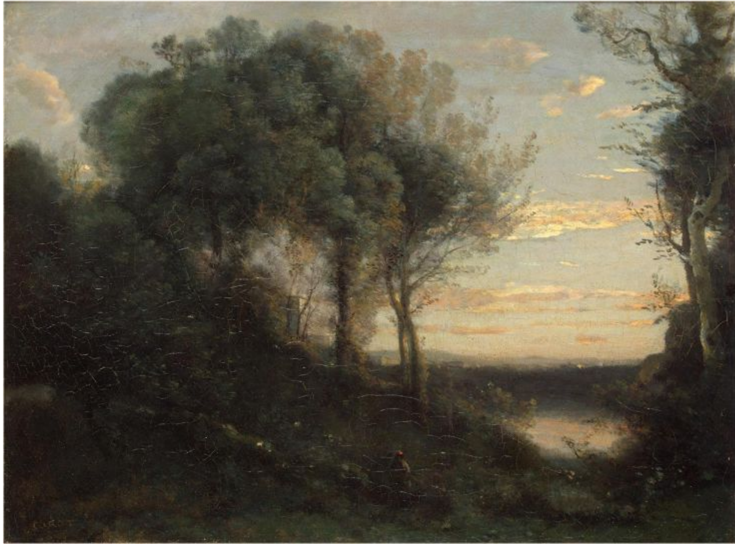
Жан Батист Камиль Коро «Вечер», 1860-е гг.