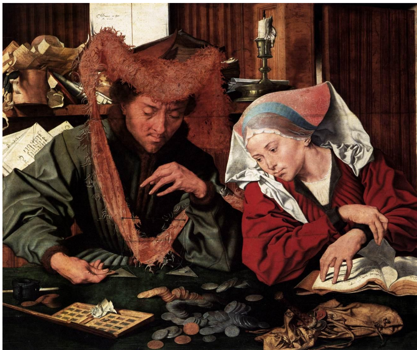
Маринус ван Реймерсвале «Меняла и его жена»