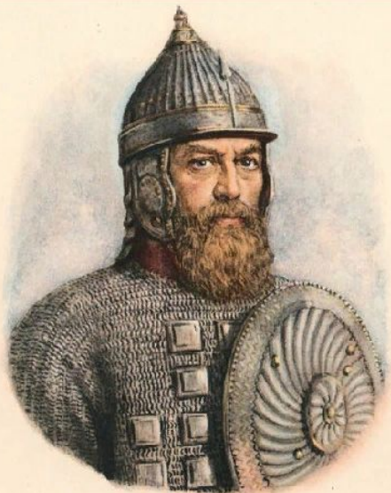
Дмитрий Пожарский 1578–1642