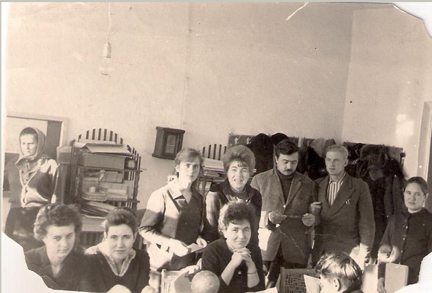
На перемене в учительской.1966 год.