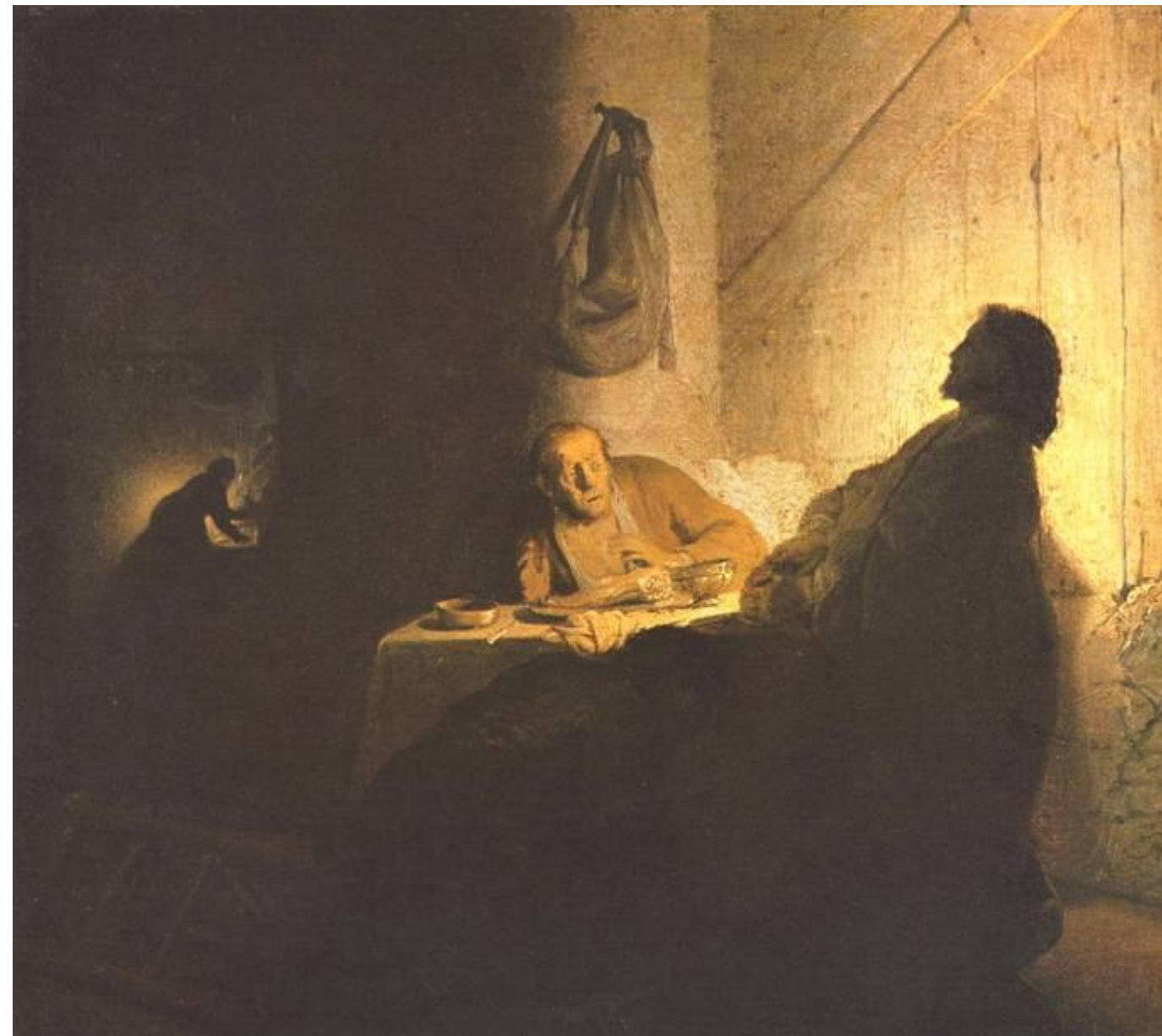
Рембрандт. Христос в Эммаусе. 1628