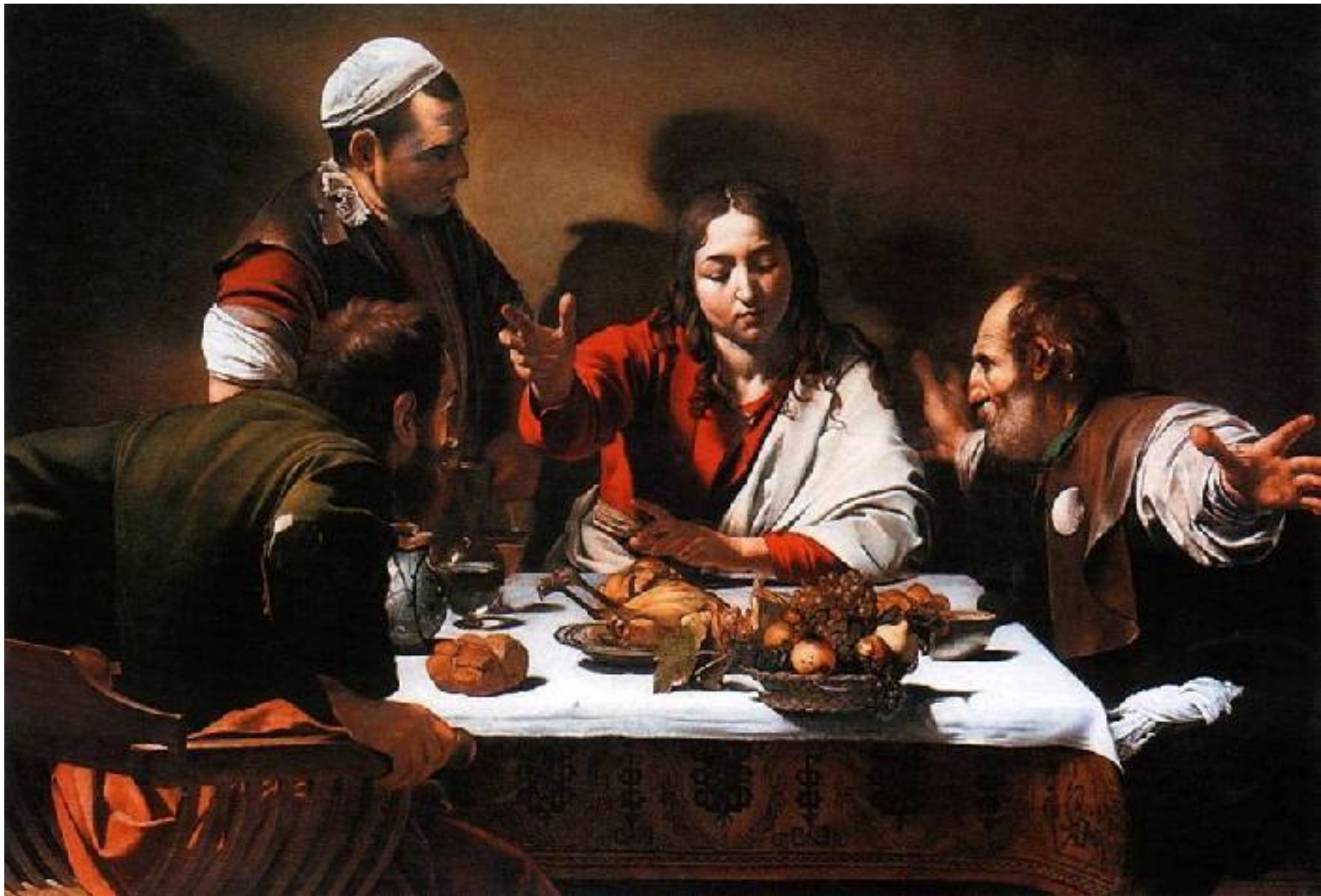
Караваджо. Ужин в Эммаусе