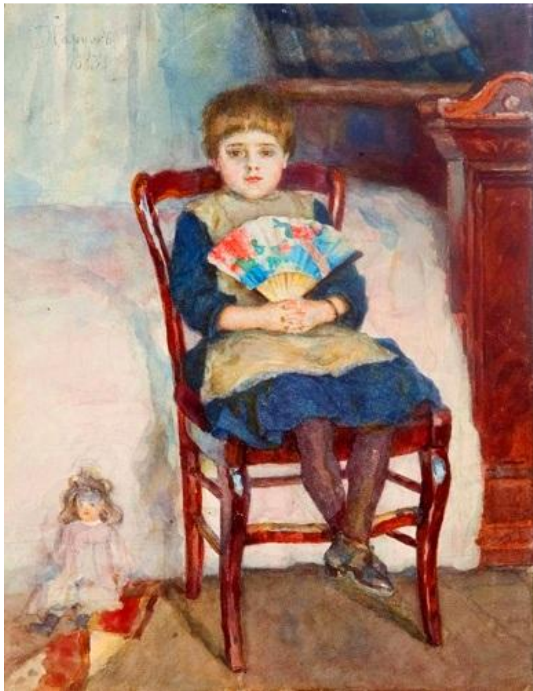
В.И.Суриков. Портрет дочери