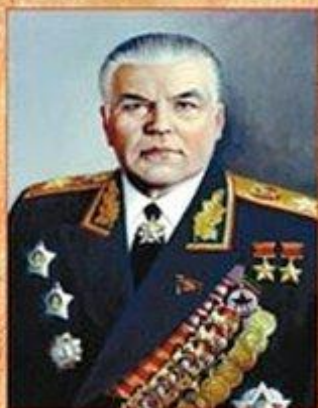
МАЛИНОВСКИЙ Родion Яковлевич (1898 - 1967)