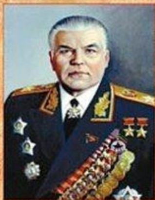
МАЛИНОВСКИЙ Родion Яковлевич (1898 - 1967)