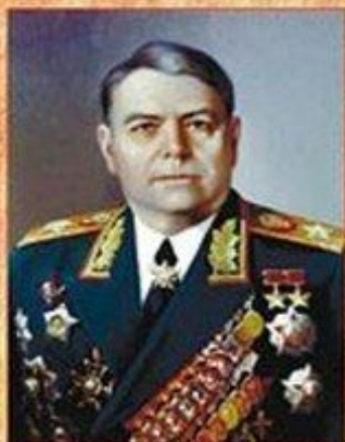
ВАСИЛЕВСКИЙ Александр Михайлович (1895 - 1977)