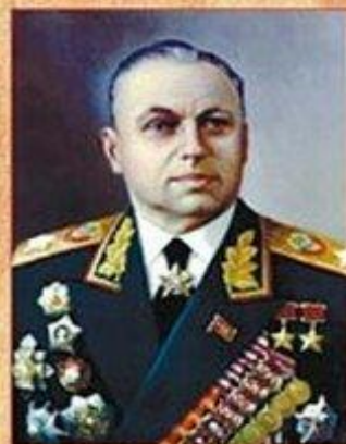
РОКОССОВСКИЙ Константин Константинович (1896 - 1968)