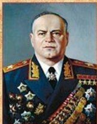
ЖУКОВ Георгий Константинович (1896 - 1974)