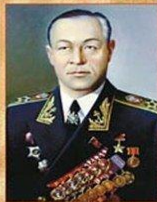
КУЗНЕЦОВ Николай Герасимович (1902 - 1974)