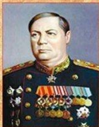
ТОЛБУХИН Федор Иванович (1894 - 1949)