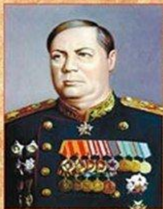
ТОЛБУХИН Федор Иванович (1894 - 1949)