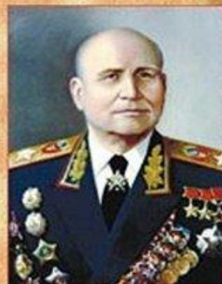
КОНЕВ Иван Степанович (1897 - 1973)