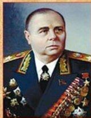
МЕРЕЦКОВ Кирилл Афанасьевич (1897 - 1968)