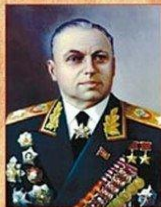
РОКОССОВСКИЙ Константин Константинович (1896 - 1968)