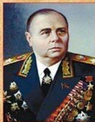
МЕРЕЦКОВ Кирилл Афанасьевич (1897 - 1968)