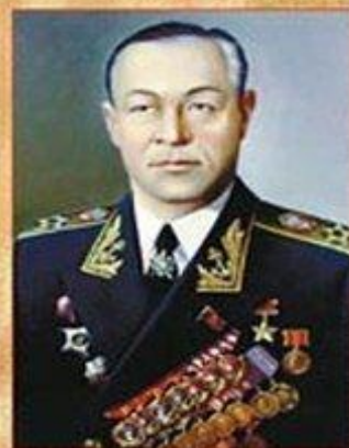
КУЗНЕЦОВ Николай Герасимович (1902 - 1974)