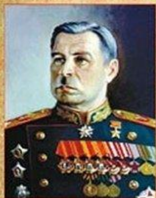
ГОВОРОВ Леонид Александрович (1897 - 1955)