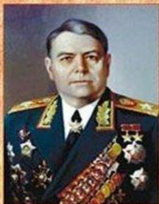
ВАСИЛЕВСКИЙ Александр Михайлович (1895 - 1977)