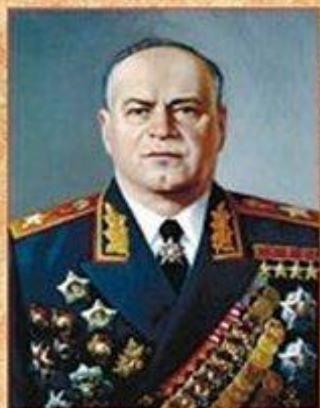
ЖУКОВ Георгий Константинович (1896 - 1974)