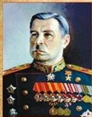
ГОВОРОВ Леонид Александрович (1897 - 1955)