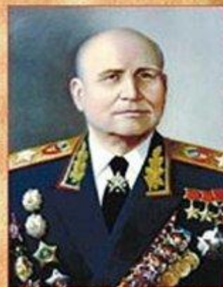
КОНЕВ Иван Степанович (1897 - 1973)