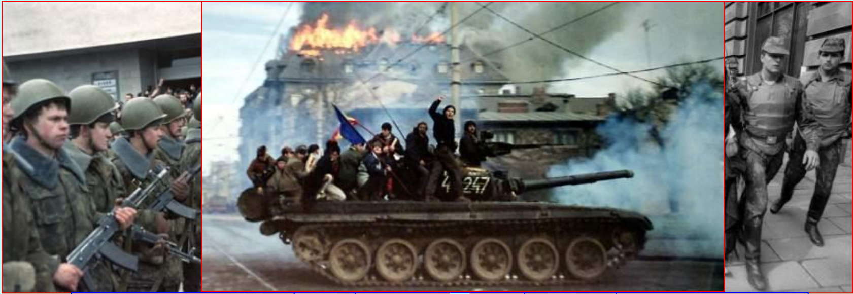
СССР. Вильнюс 1990 Румыния. Бухарест 1989 СР. Тбилиси 1989 г.

В авторитарных и тоталитарных системах наиболее ярким проявлением кризиса и неспособности системы функционировать по-старому становятся широкие выступления народных масс, приводящие либо к распаду системы в целом, либо к ужесточению режима и широкому применению насилия для подавления проявлений инакомыслия.