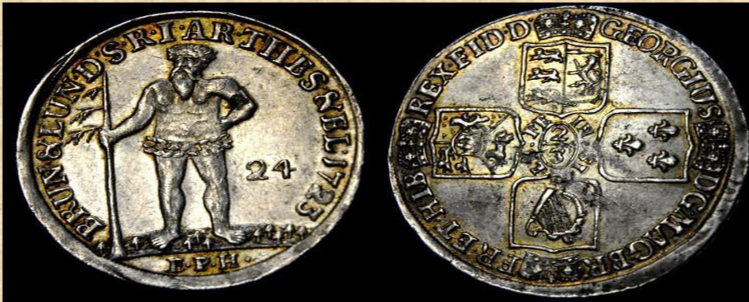
Монеты Ганзейского союза

Развитию Ганзы способствовали единая денежная система, равноправие родных языков, а также равные права жителей городов данного союза. Примечательно, что ганзейцы распространяли идеи о здоровом образе жизни. Они активно внедряли представляемый ими деловой этикет. Открывали клубы, где купцы обменивались опытом и бизнес идеями, а также распространяли различные технологии производства продуктов и товаров.