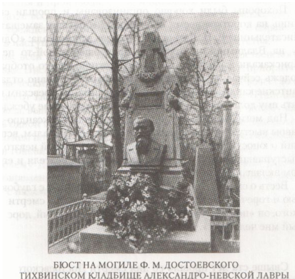
БЮСТ НА МОГИЛЕ Ф. М. ДОСТОЕВСКОГО ТИХВИНСКОМ КЛАДБИЩЕ АЛЕКСАНДРО-НЕВСКОЙ ЛАВРЫ

Похоронен Достоевский 31 января в Александро-Невской лавре.