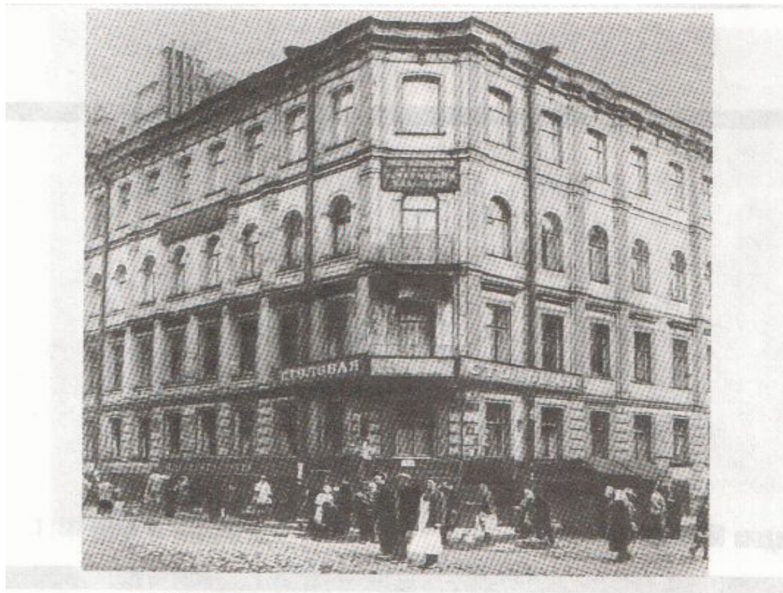
ПЕТЕРБУРГ. КУЗНЕЧНЫЙ ПЕР., 5 – ДОМ, ГДЕ БЫЛА ПОСЛЕДНЯЯ КВАРТИРА Ф. М. ДОСТОЕВСКОГО Фотография. 1929 г.

В ночь с 25 на 26 января 1881 года Ф. М. Достоевский скончался.