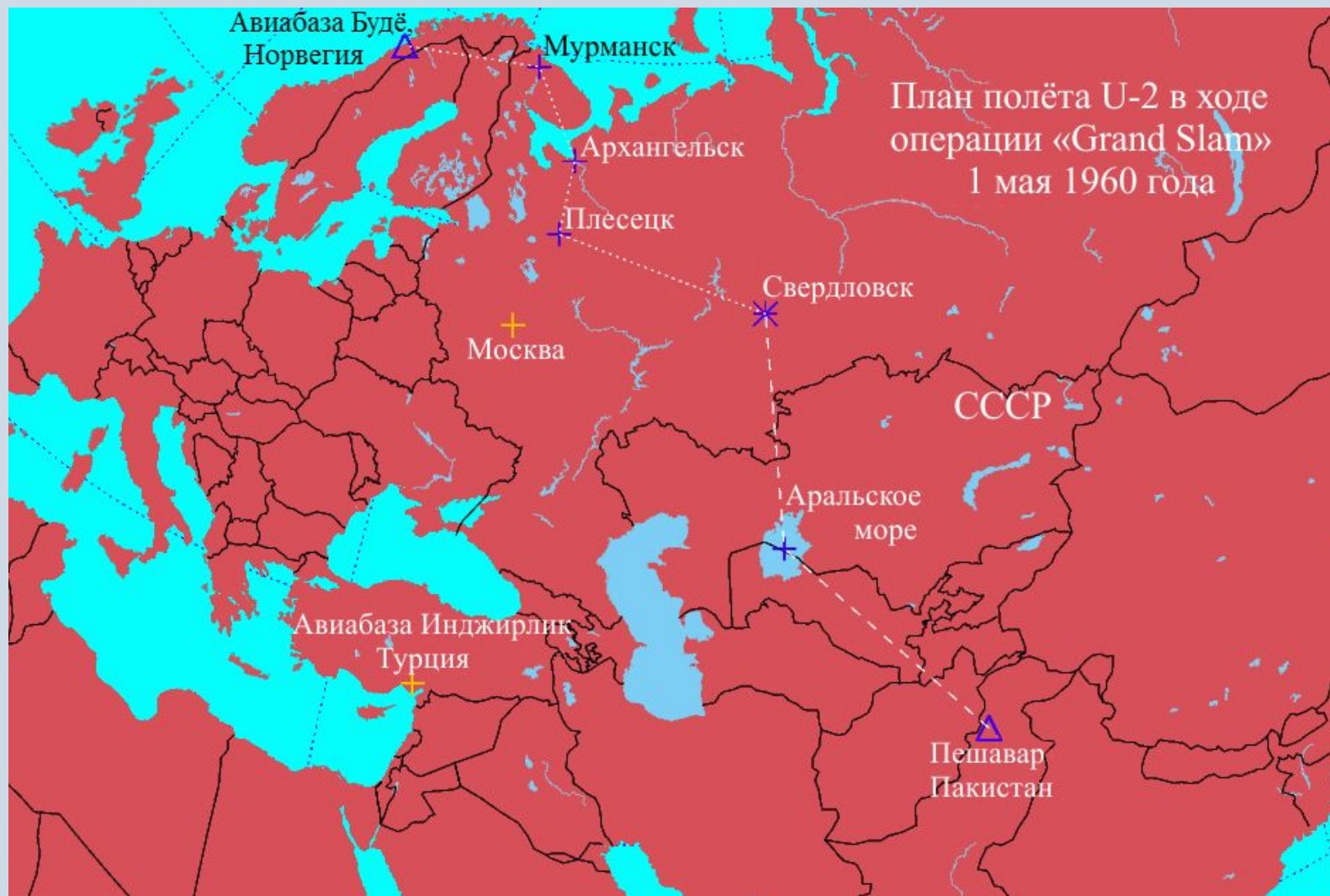
План полёта U-2 в ходе операции «Grand Slam» 1 мая 1960 года