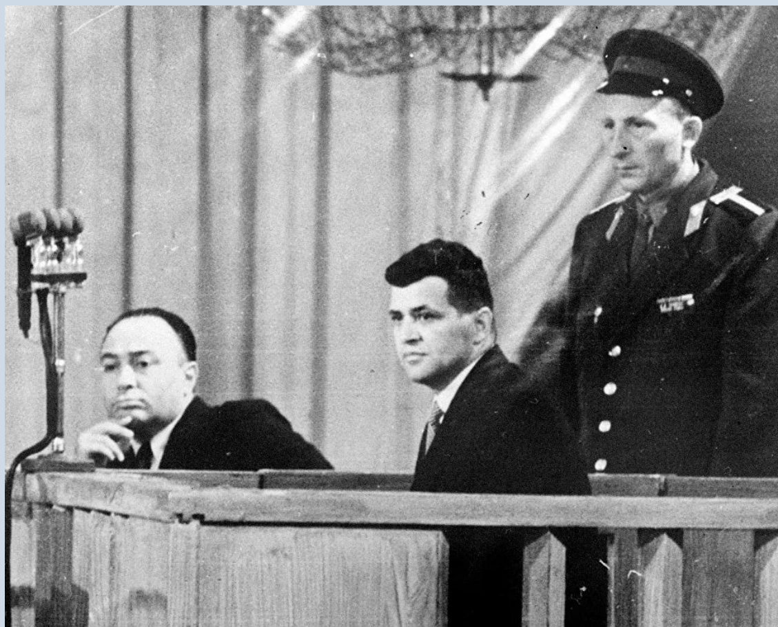
Суд над американским пилото Фрэнсисом Гэри Пауэрсом в московском Колонном зале