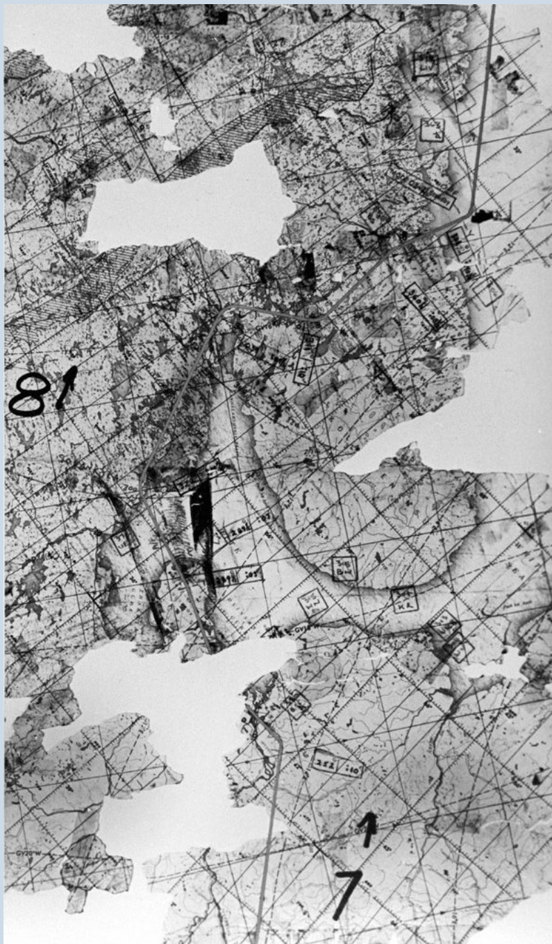
Часть карты (окрестности Белого моря) с полётным заданием, найденная в сбитом самолёте