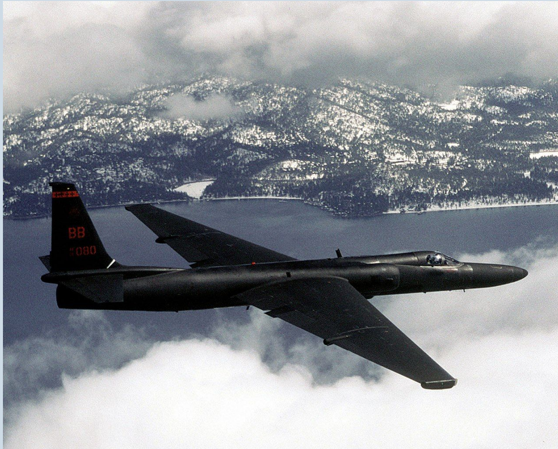
Lockheed U-2, идентичный сбитому

1 мая 1960 года во время руководства первого секретаря ЦК КПСС и председателя Совета министров СССР Никиты Хрущёва и президента США Дуайта Эйзенхауэра произошёл инцидент в воздушном пространстве СССР, а именно был сбит самолёт-разведчик Lockheed U-2.