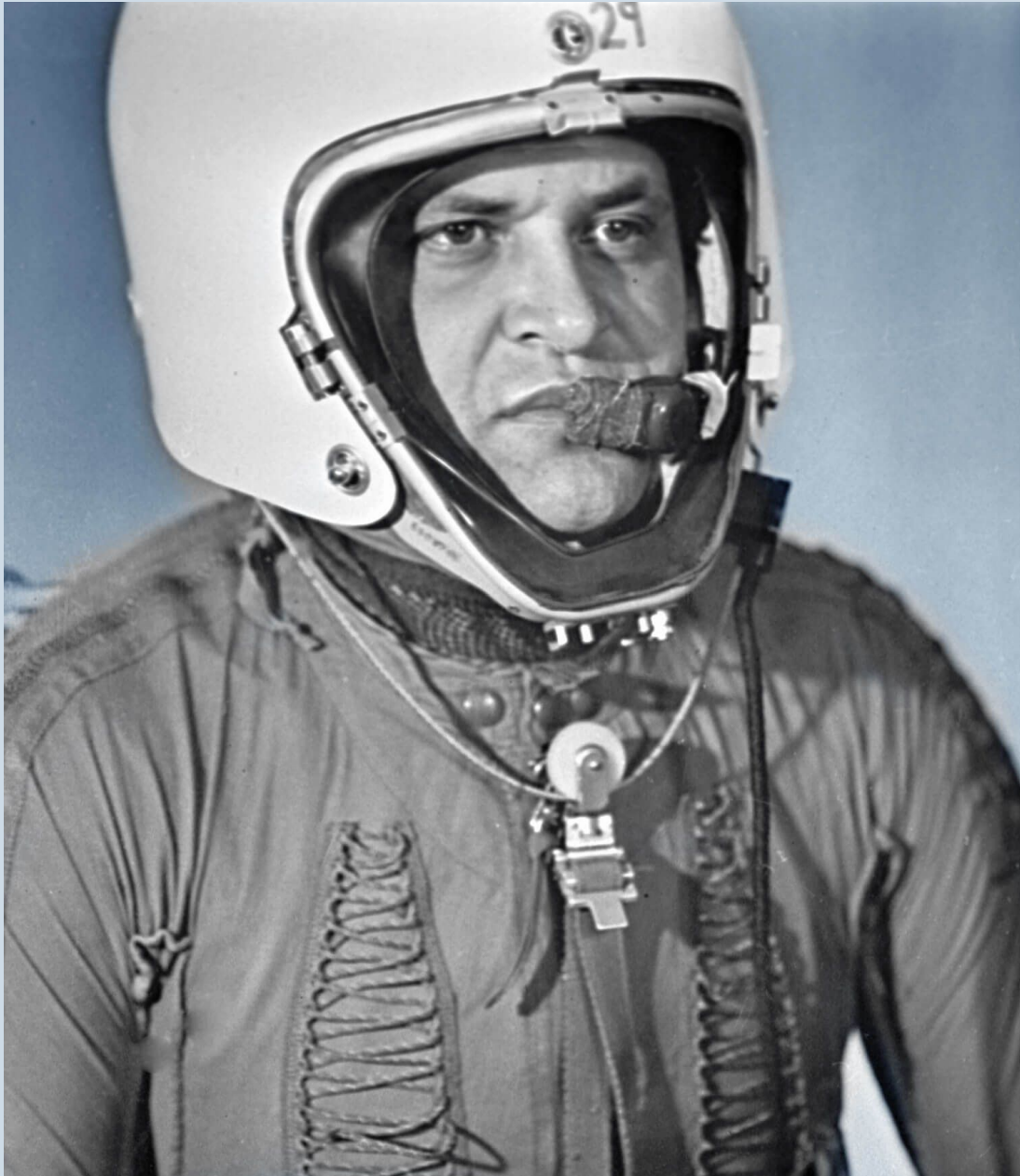
Фрэнсис Гэри Пауэрс