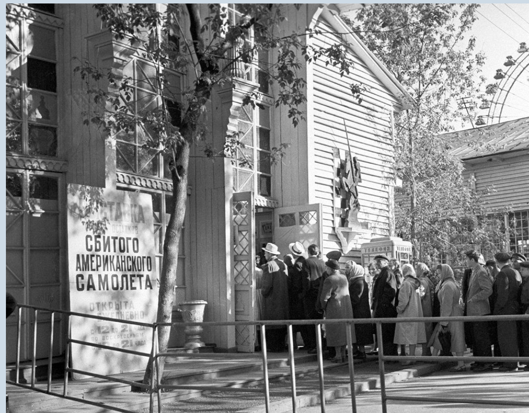
Выставка сбитого самолёта