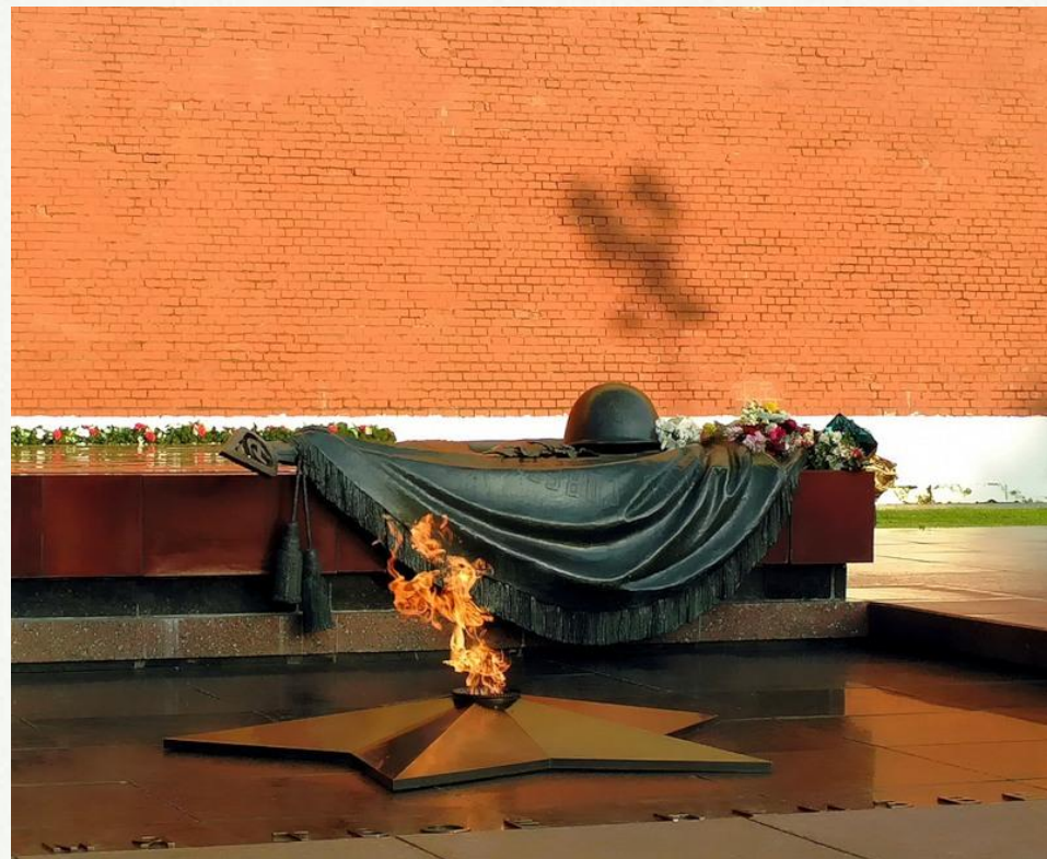
Москва. Александровский сад.