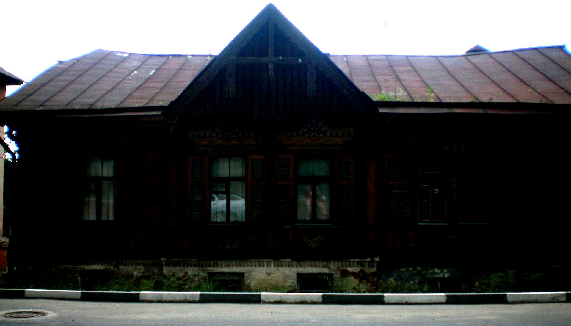
Старинный дом в г. Курске по улице им. Щепкина