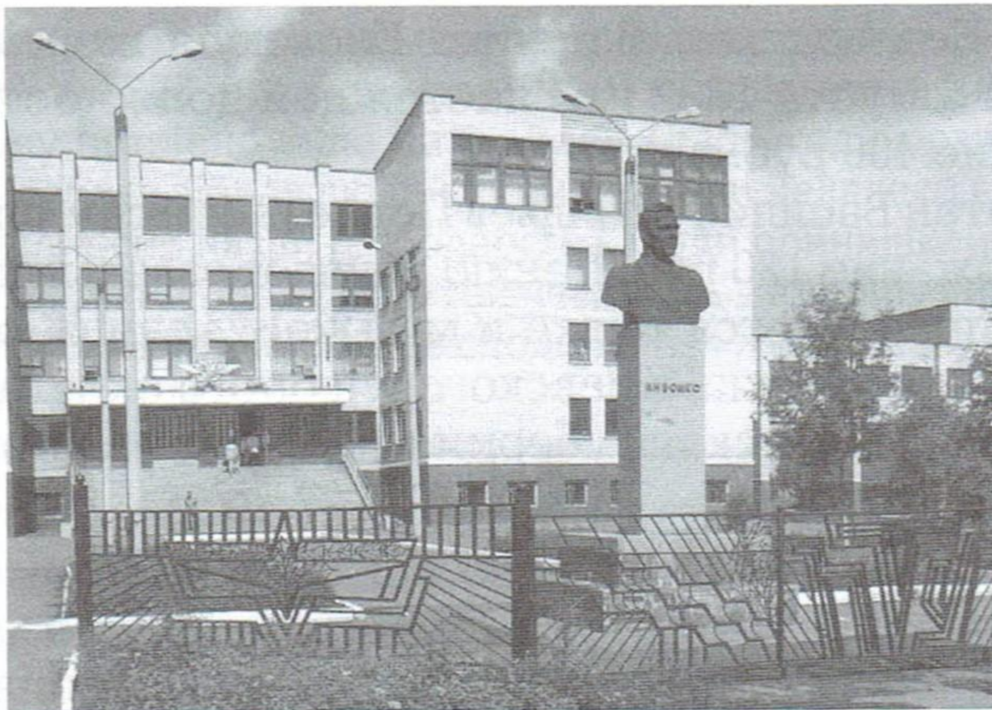
Державний професійно-технічний навчальний заклад «Козятинське міжрегіональне вище професійне училище залізничного транспорту»