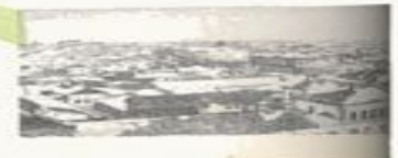
Уральск 1895 - 1907