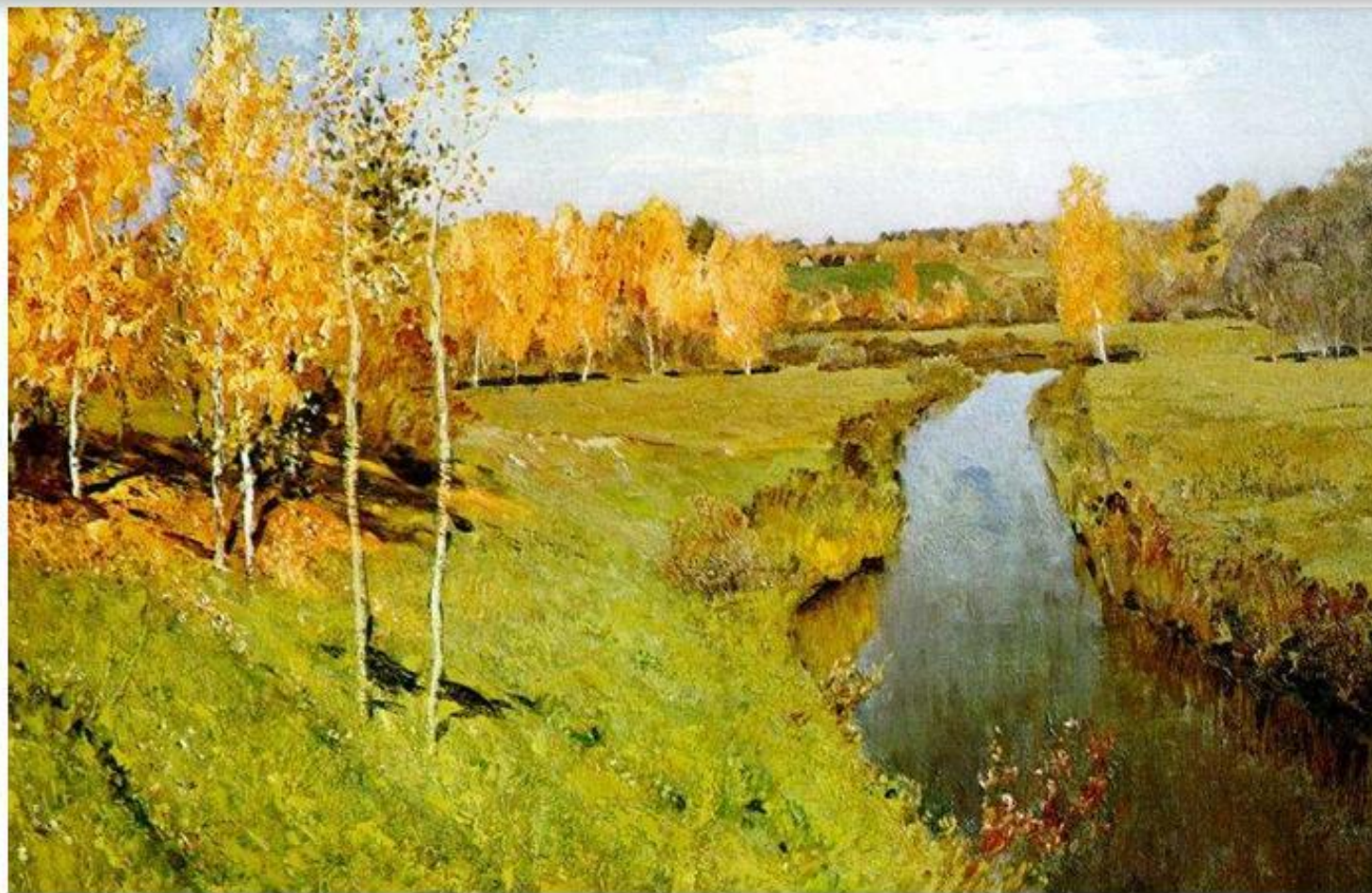
Золотая осень.Исаак Левитан