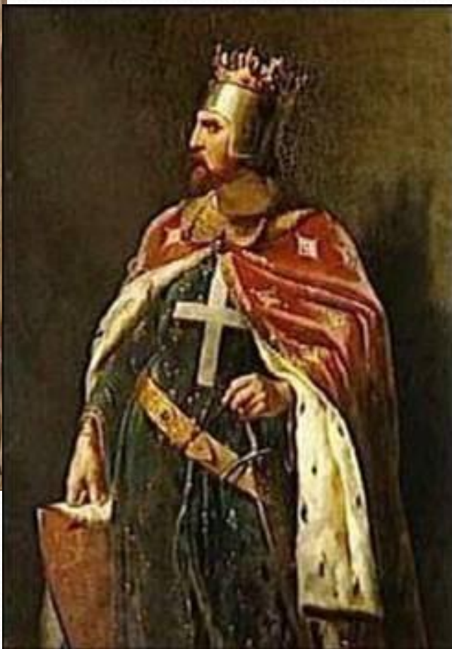
Ричард I Львиное Сердце