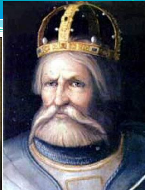
Фридрих I Барбаросса