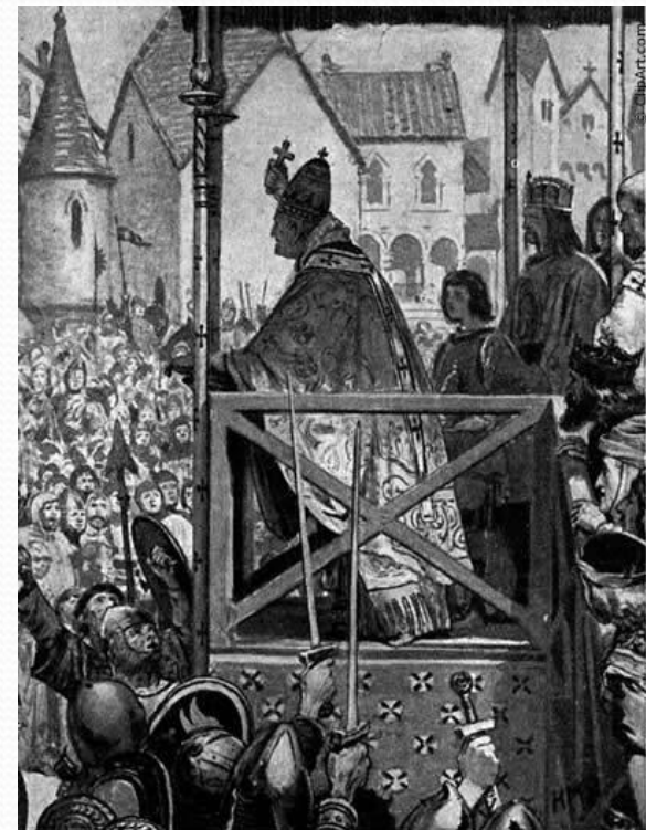
Pope Urban II Preaches the First Crusade