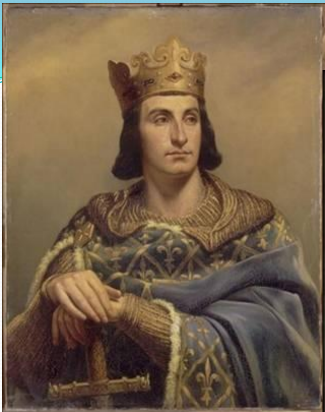
Филипп II Август