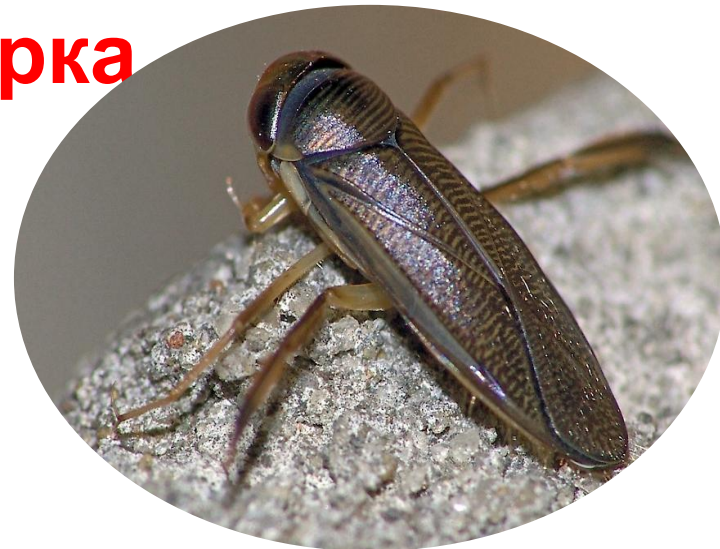
Гребляк (водный клоп)