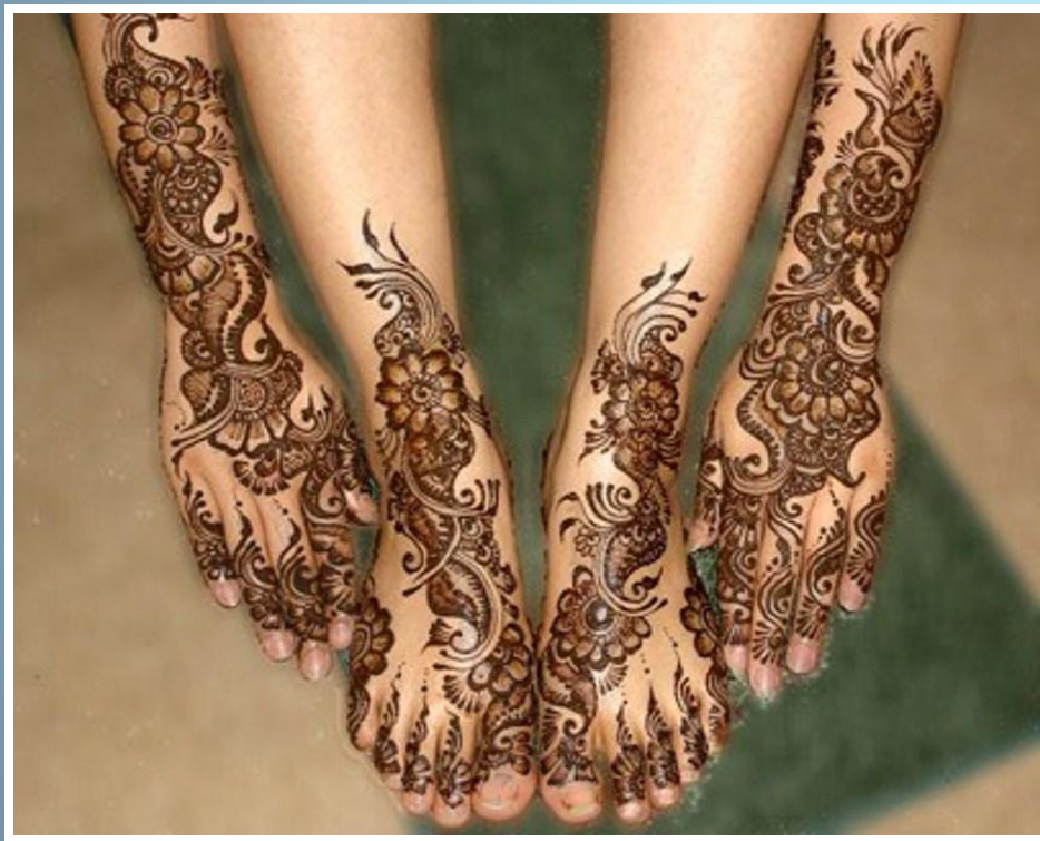
Михенди – рисунок хной