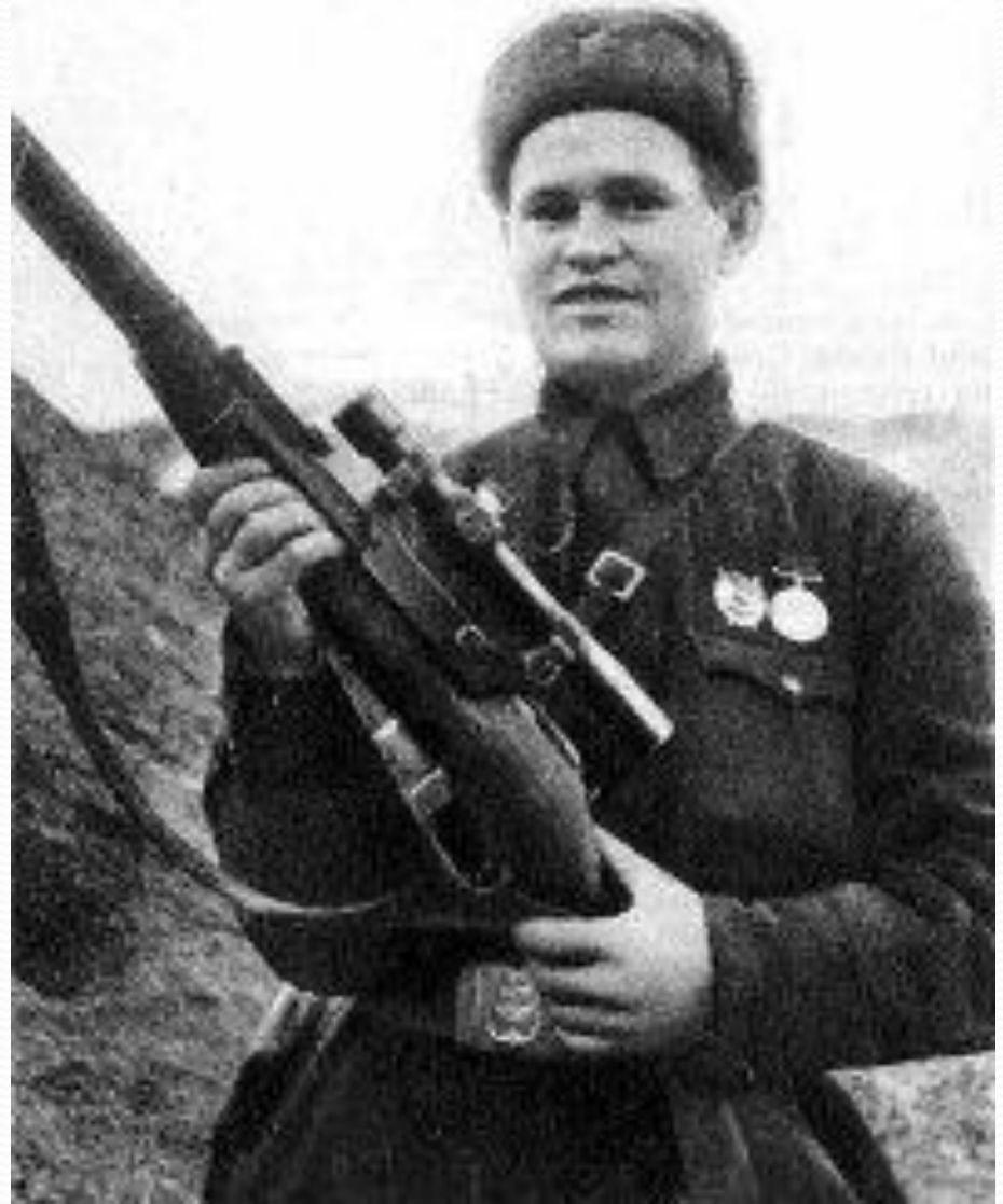
Vasily Zaitsev in Stalingrad, October 1942

В Сталинград он был направлен в сентябре 1942 г., В период Сталинградской битвы Василий Зайцев уничтожил 242 вражеских солдата и офицера, 11 немецких снайперов. За Сталинградскую битву был удостоен звания Героя Советского Союза.