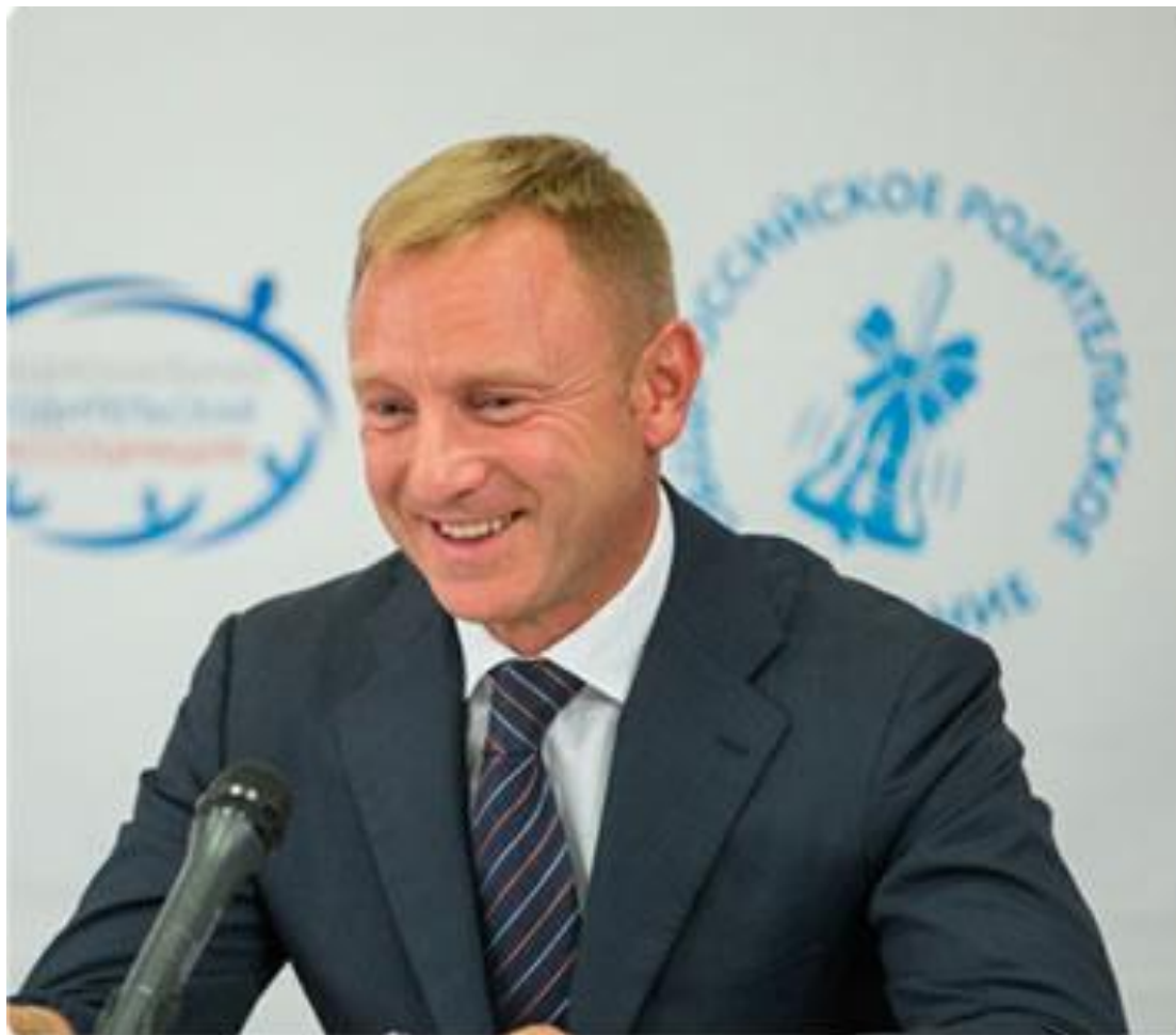
Дмитрий Викторович Ливанов министр образования и науки РФ