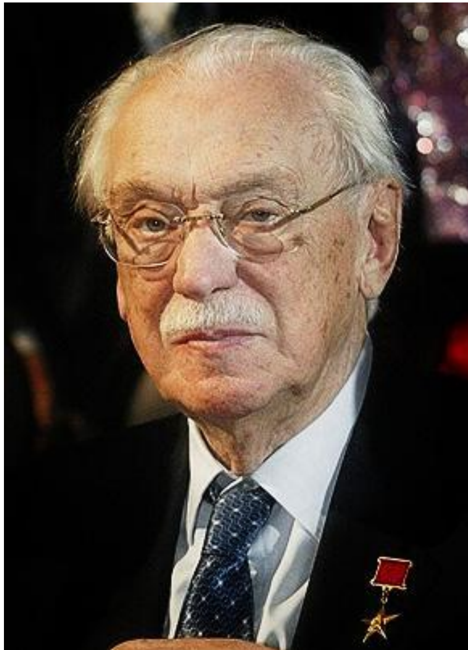
Сергей Владимирович Михалков 1913 – 2009 г. автор текста гимна