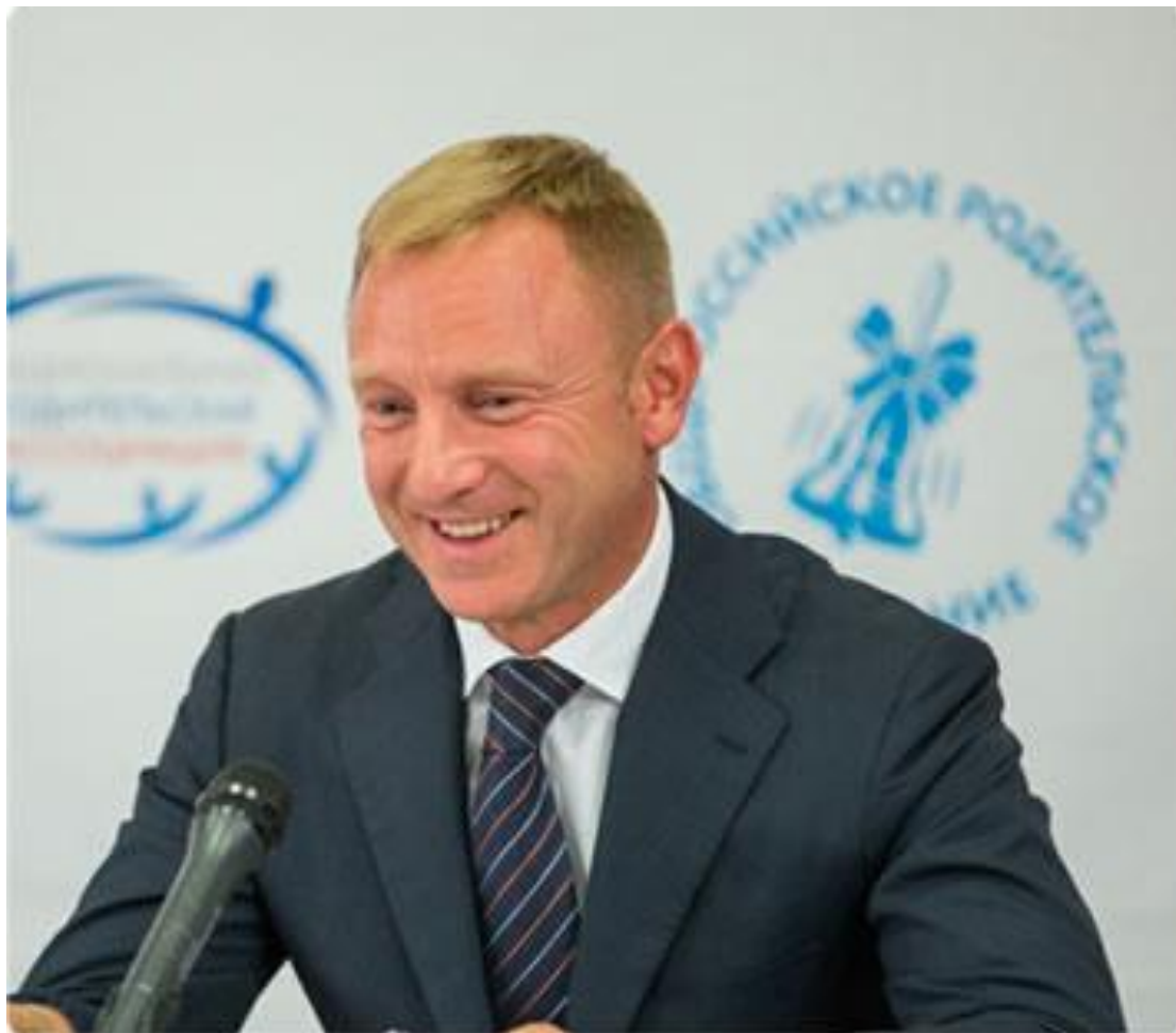
Дмитрий Викторович Ливанов министр образования и науки РФ