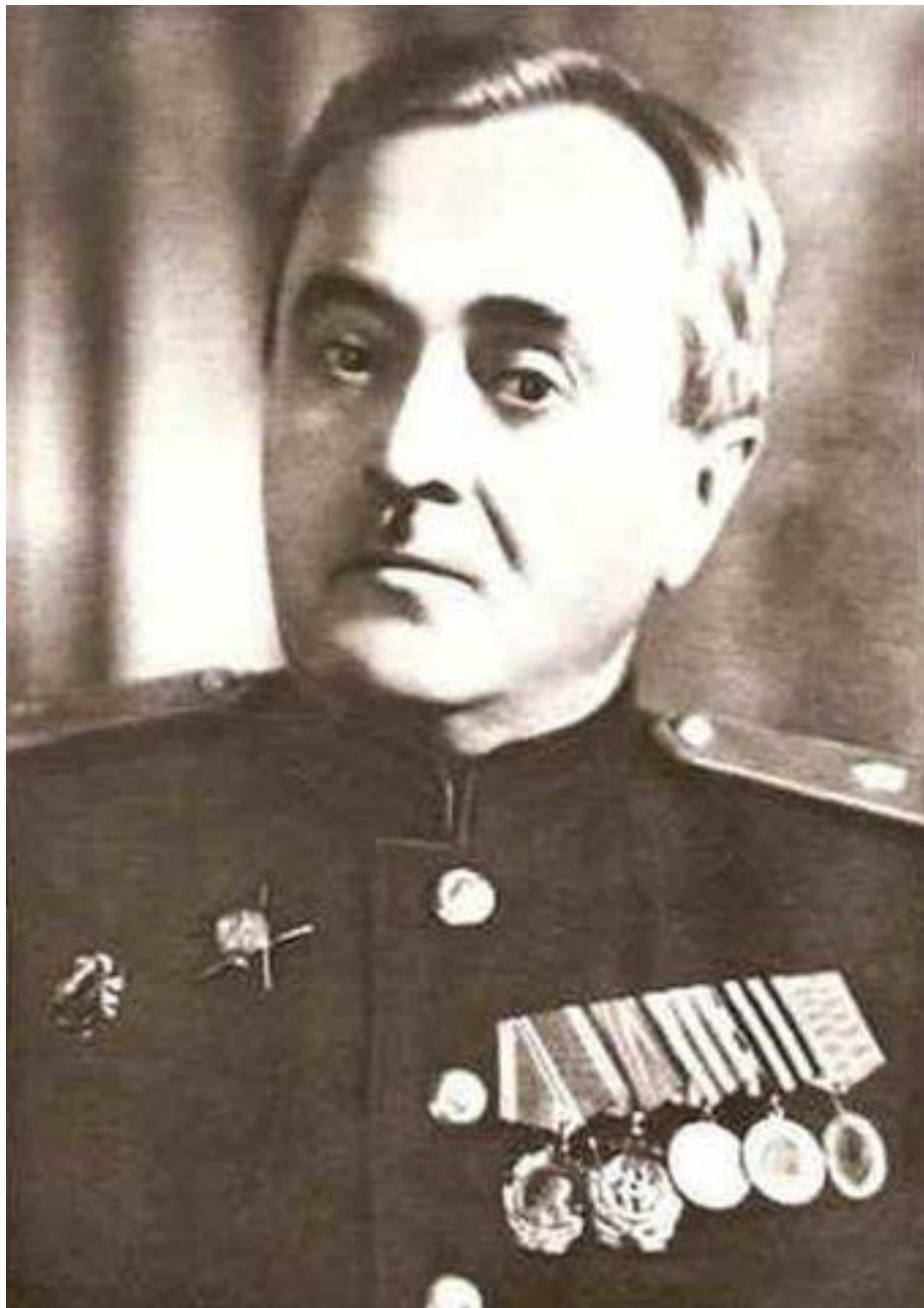
Александр Васильевич Александров 1883 – 1946 г. автор музыки гимна