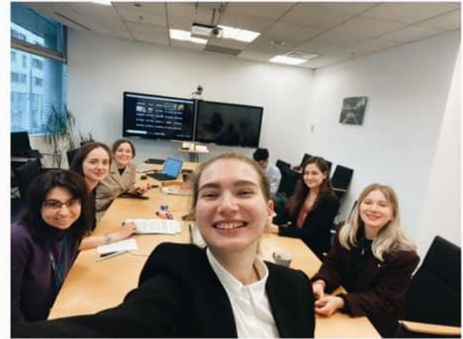
Москва, онлайн раунды 2020