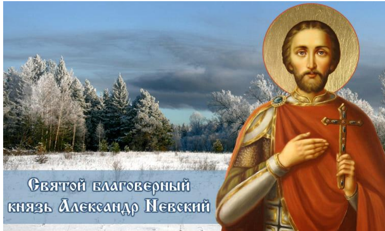
СВЯТОЙ БЛАГОВЕРНЫЙ КНЯЗЬ АЛЕКСАНДР НЕВСКИЙ

Посмертное почитание князя имеет долгую традицию. Его епархиальная канонизация состоялась практически сразу после смерти: Александр был причислен к чину святых воинов, и вскоре после 1263 г. составляется первоначальная «Повесть о житии».