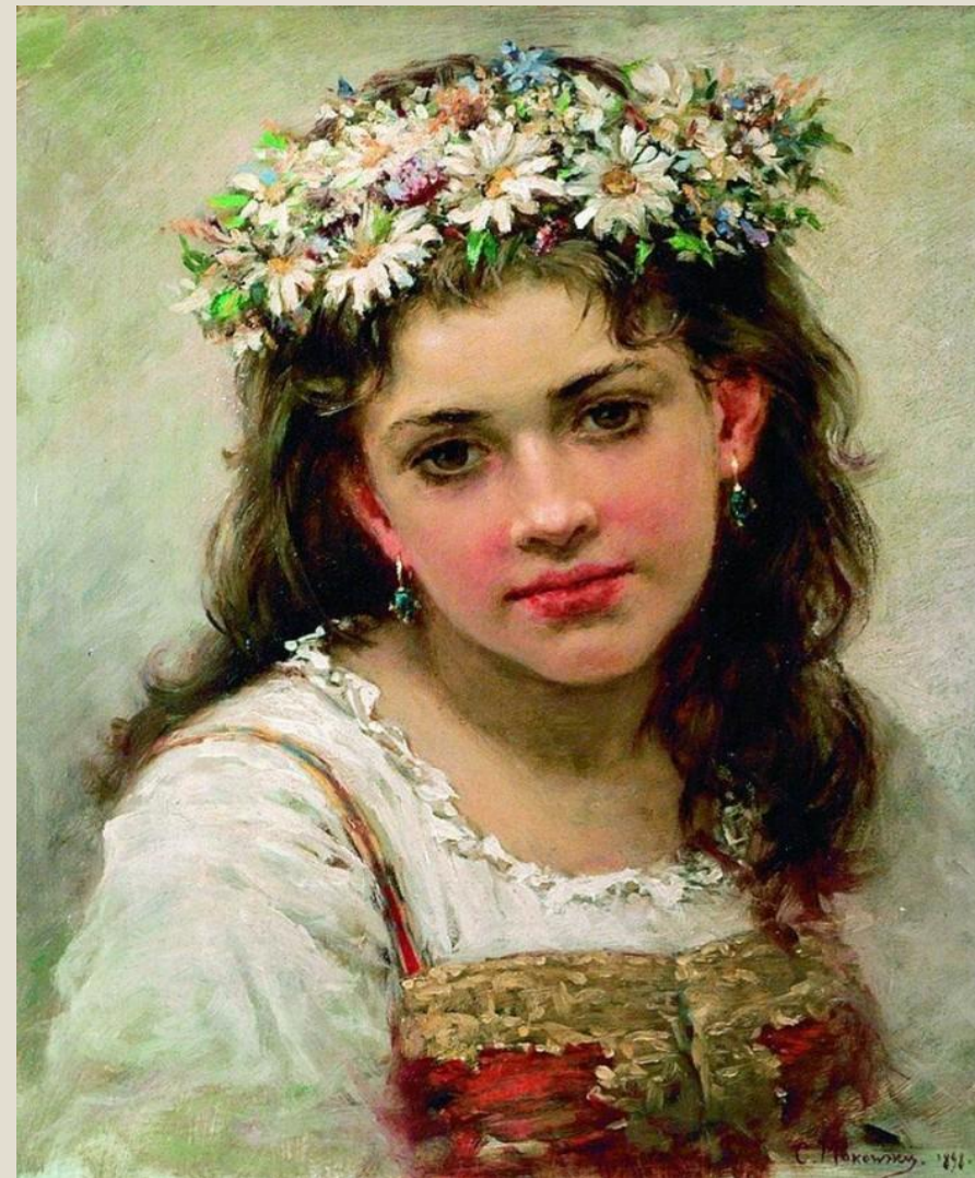
Маковский К.Е. (1839 – 1915)