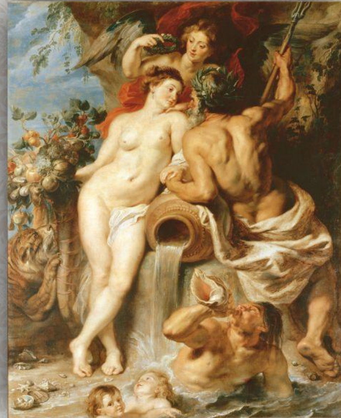
(Рубенс. Союз земли и воды.)

законов, что есть в прекрасной вещи, мы говорим, что