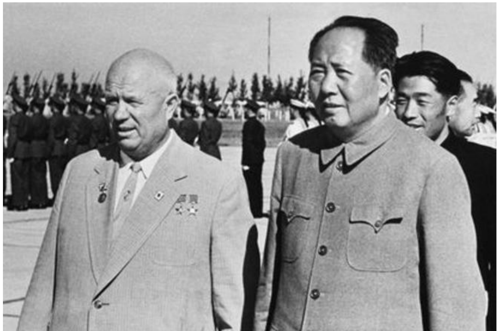
Делегация КПК в Москве в 1964г.