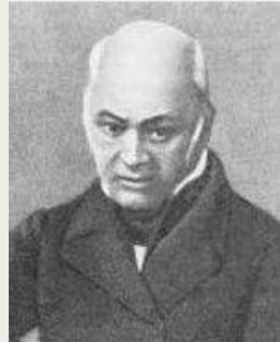
Василий Федорович Саблер

Василий Федорович Саблер (1797—1877 гг.), главный врач московской Преображенской психиатрической больницы (Психиатрический стационар имени В. А. Гиляровского) в 1832—1871 гг. Он изменил условия содержания и лечения пациентов: были отменены цепи, ограничены смирительные средства, введена трудотерапия и т. д.