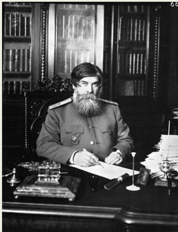
Владимир Михайлович Бехтерев