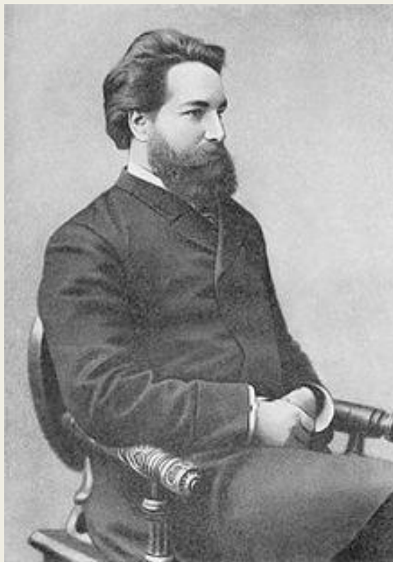
Сергей Сергеевич Корсаков