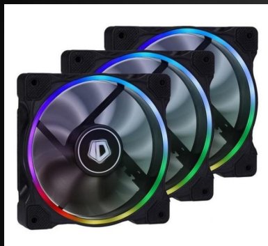
Жүйелік блоктарға арналған желдеткіштер