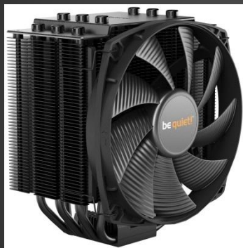
Процессорға арналған кулер