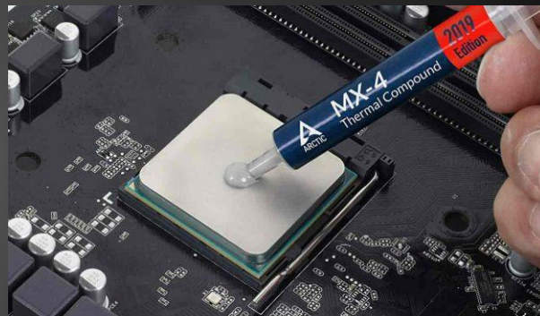
Процессорға арналған термопаста