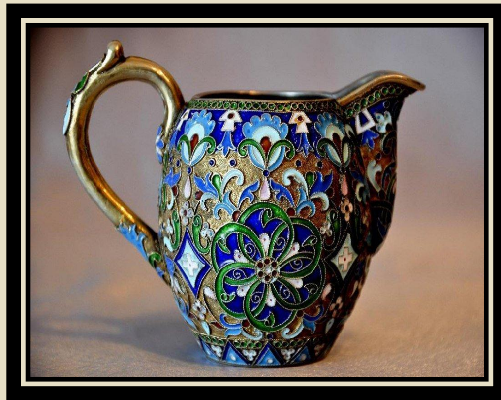
Антикварный серебряный МОЛОЧНИК