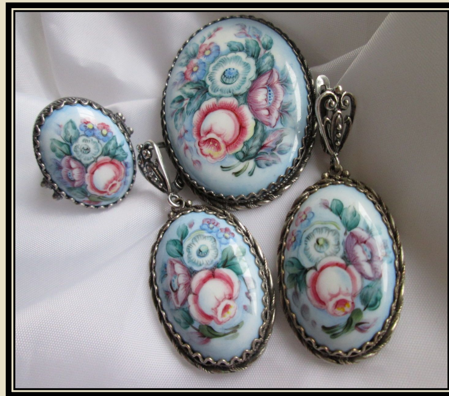
Гарнитур: серьги, кольцо, брошь