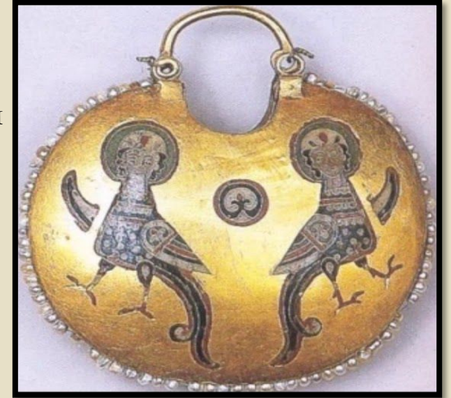
Золотые колты с парным изображением сирена, выполненными в технике перегородчатой эмали.