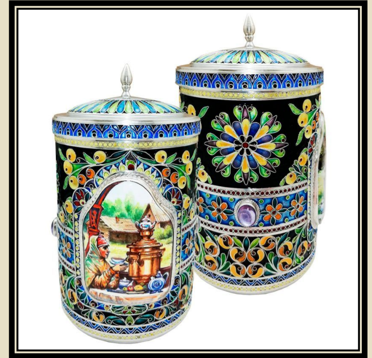
Чаша для хранения чая