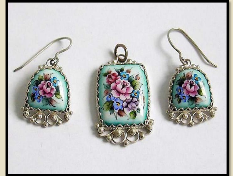
Серьги и подвеска (Работа современных мастеров)