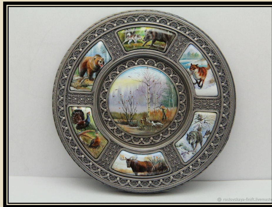
Декоративное панно- тарелка