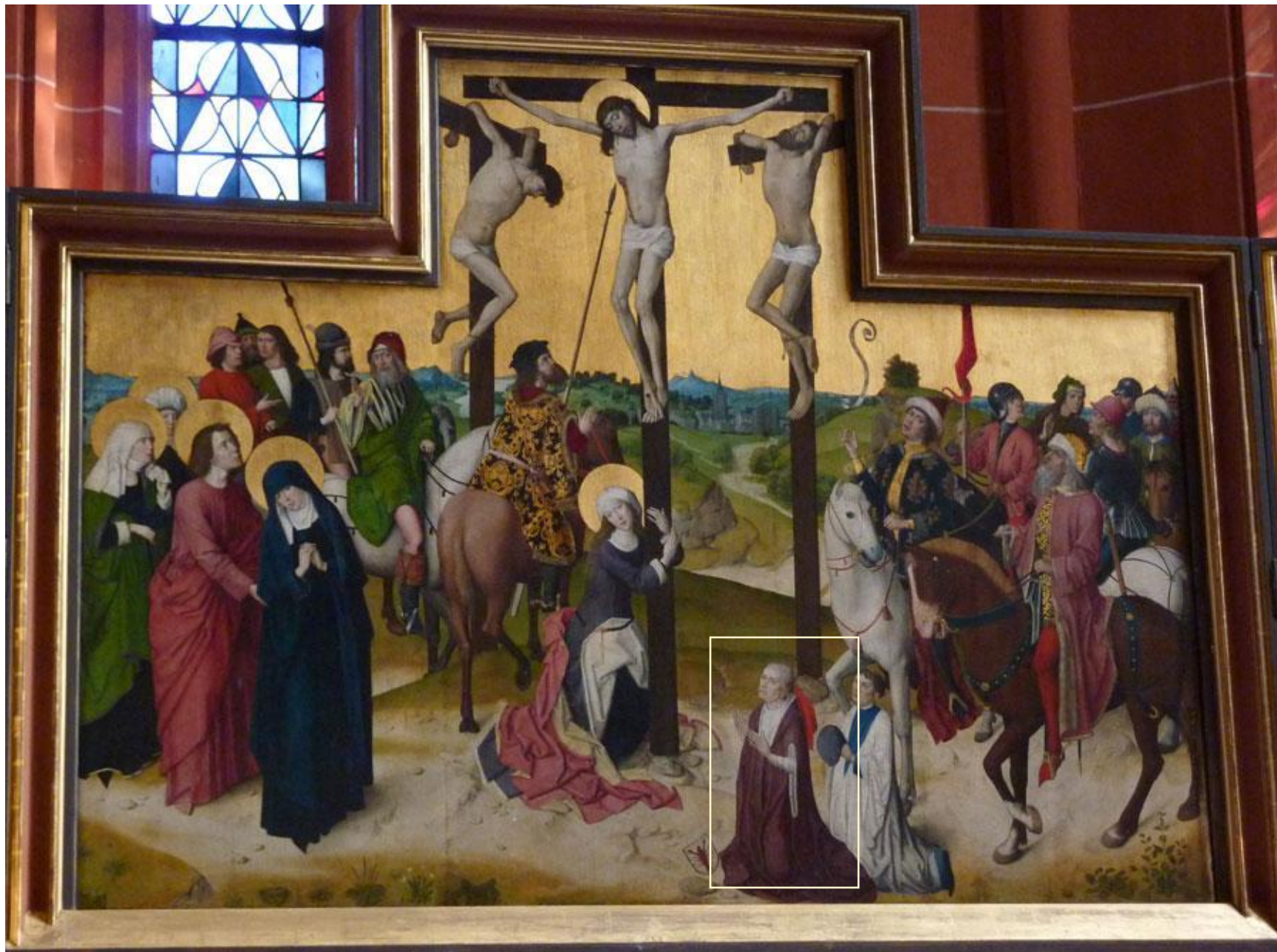
"Распятие". XV век. Внизу нарисован Николай Кузанский