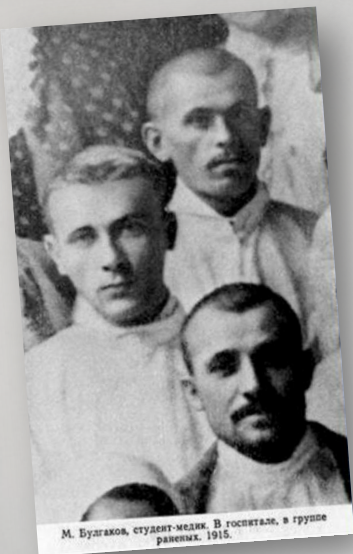
М. Булгаков, студент-медик. В госпитале, в группе раненых. 1915.