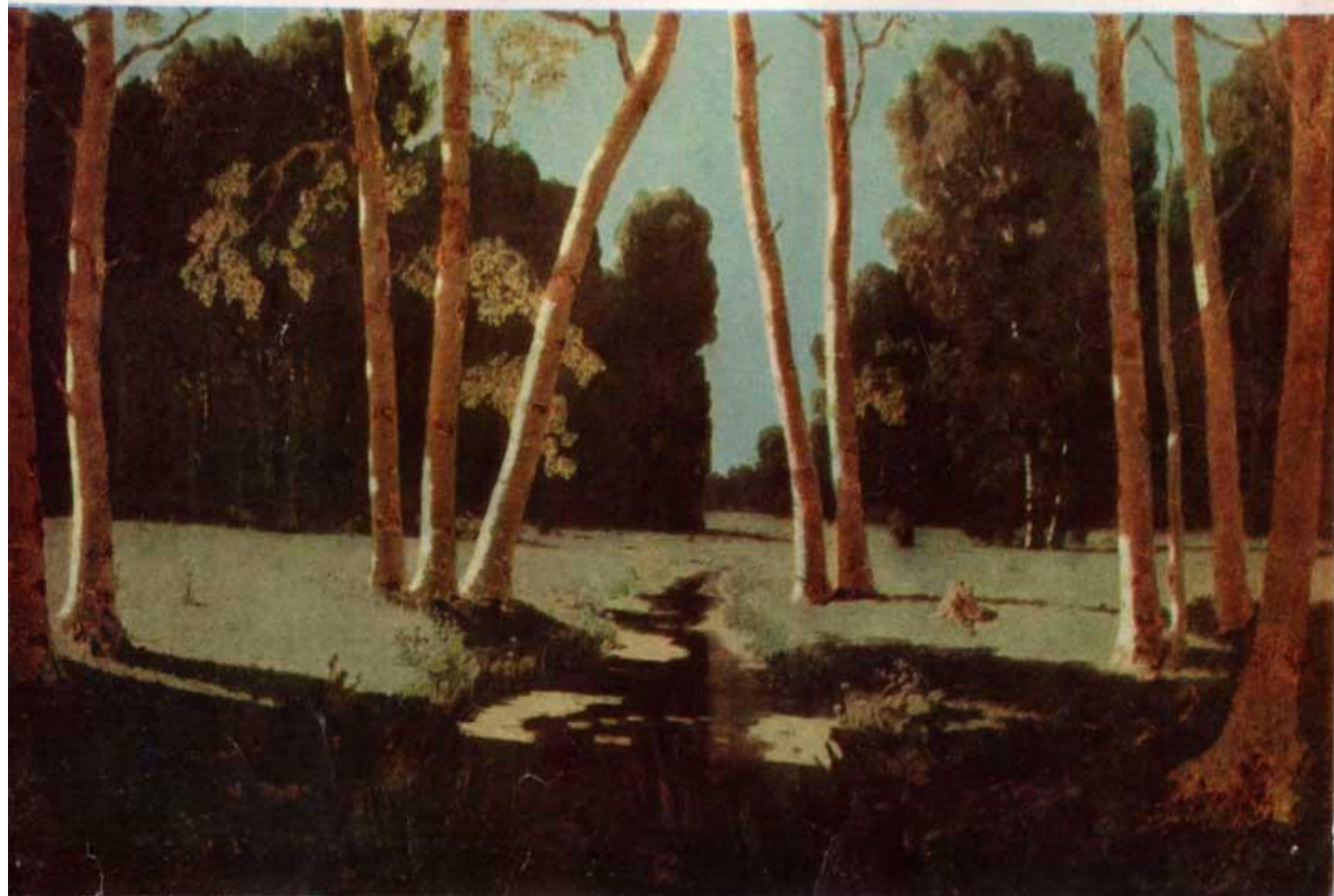
БЕРЕЗОВАЯ РОЩА. 1879.