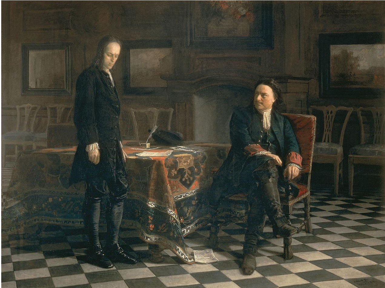
Пётр I допрашивает царевича Алексея в Петергофе. Н. Н. Ге, 1871

Уже на следующий день после церемонии отречения началось следствие, порученное Тайной канцелярии и возглавленное графом Толстым. Алексей в своих показаниях постарался изобразить себя жертвой своего окружения и свалить на своих приближённых всю вину. Лица, его окружавшие, были казнены, но это не помогло Алексею — его любовница Ефросинья дала исчерпывающие показания, изобличившие Алексея во лжи.