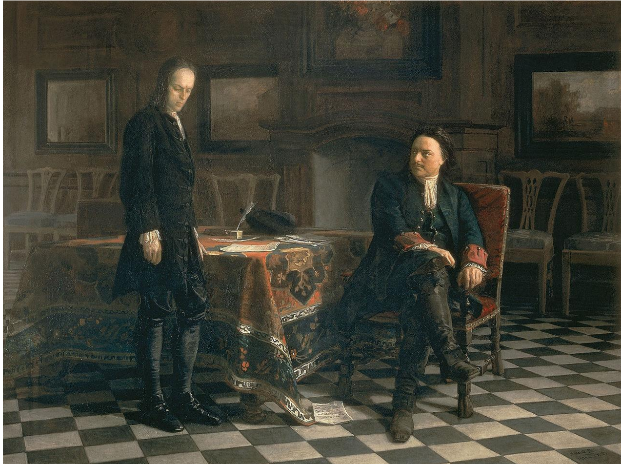
Пётр I допрашивает царевича Алексея в Петергофе. Н. Н. Ге, 1871

Уже на следующий день после церемонии отречения началось следствие, порученное Тайной канцелярии и возглавленное графом Толстым. Алексей в своих показаниях постарался изобразить себя жертвой своего окружения и свалить на своих приближённых всю вину. Лица, его окружавшие, были казнены, но это не помогло Алексею — его любовница Ефросинья дала исчерпывающие показания, изобличившие Алексея во лжи.