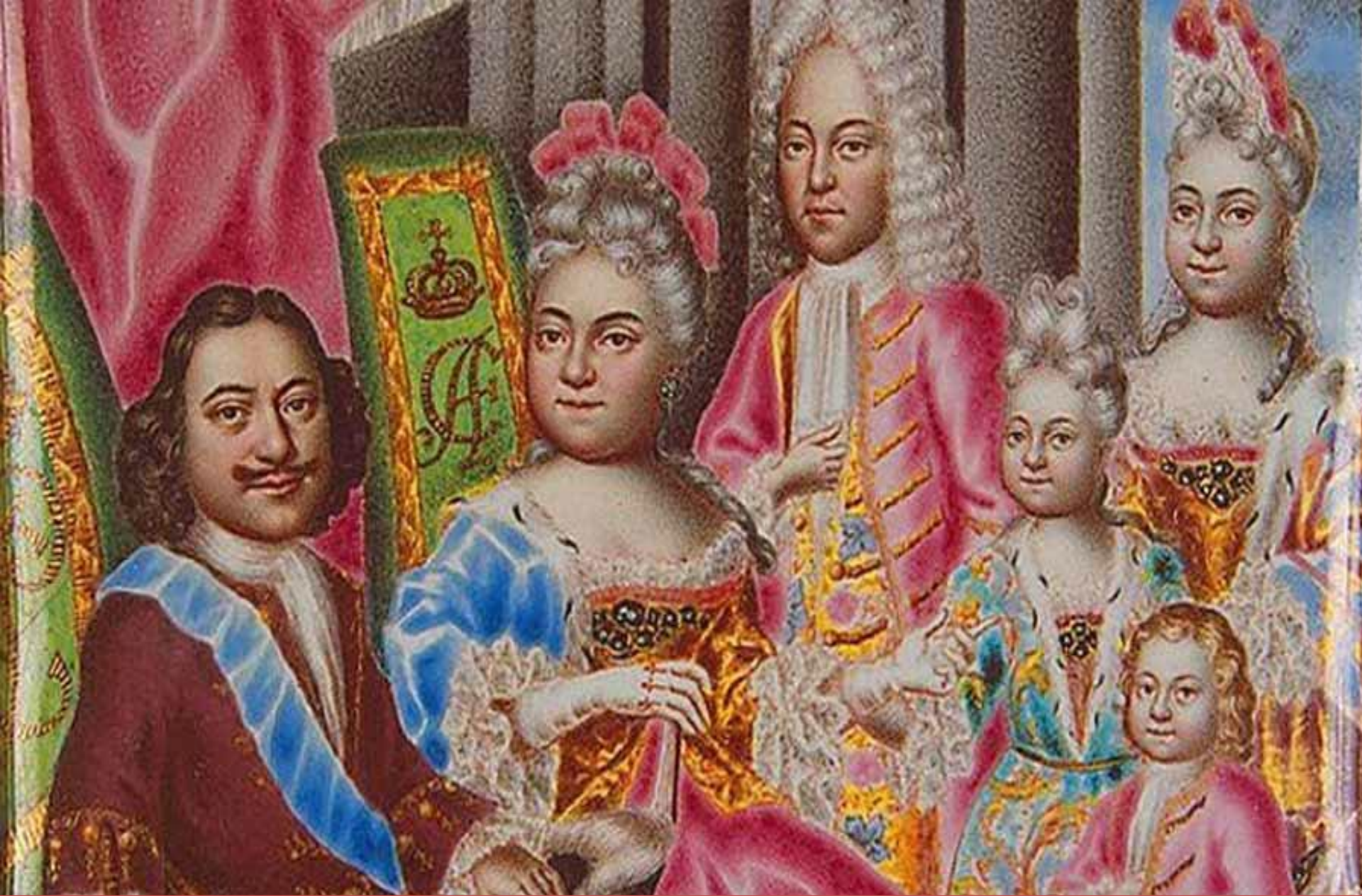
Семейный портрет Петра вместе с Екатериной, сыном царевичем Алексеем и детьми от второй жены