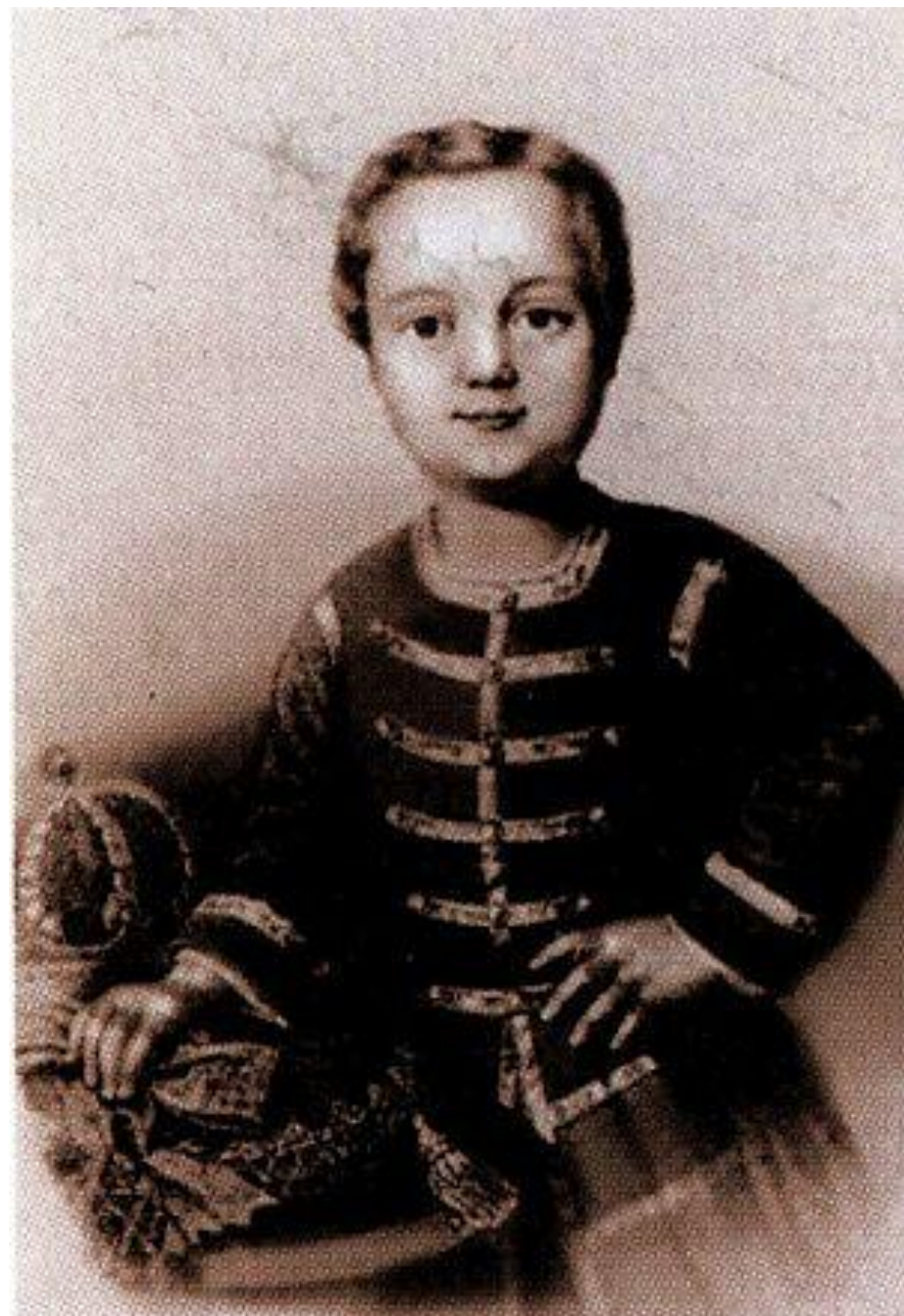
Сын Петра I Петр Петрович

После возвращения за тайное бегство и деятельность во время пребывания за границей Алексей был лишён права на престолонаследие (манифест 3(14) февраля 1718 года ), причём он сам дал торжественную клятву об отказе от престола в пользу брата Петра Петровича в Успенском соборе Кремля в присутствии отца, высшего духовенства и высших сановников. При этом ему было объявлено прощение на условии признания всех совершённых проступков