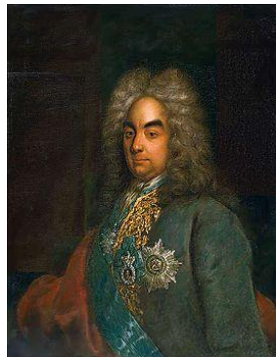
Петр Андреевич Толстой

Император Священной Римской империи отказался выдать Алексея, но разрешил допустить к нему П.Толстого. Последний предъявил Алексею письмо Петра, где царевичу гарантировалось прощение любой вины в случае немедленного возвращения в Россию