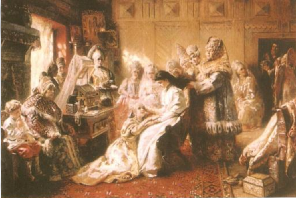
К. Моховский. «Под венец»