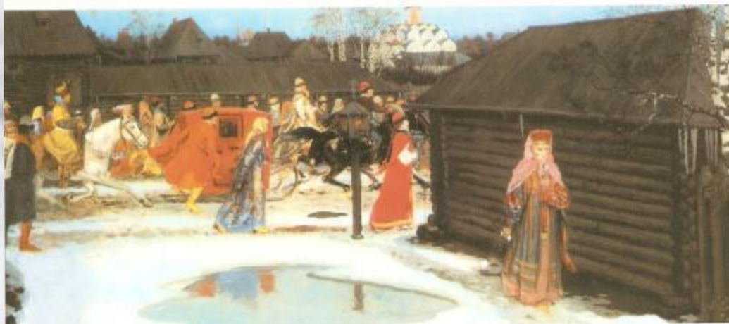
А. Рабушкин. «Свадебный поезд в Москве (XVII столетие)»