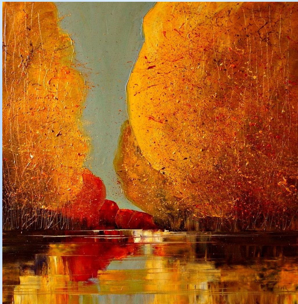
Пейзаж маслом Ж. Копана

Современные художники используют разные техники рисования