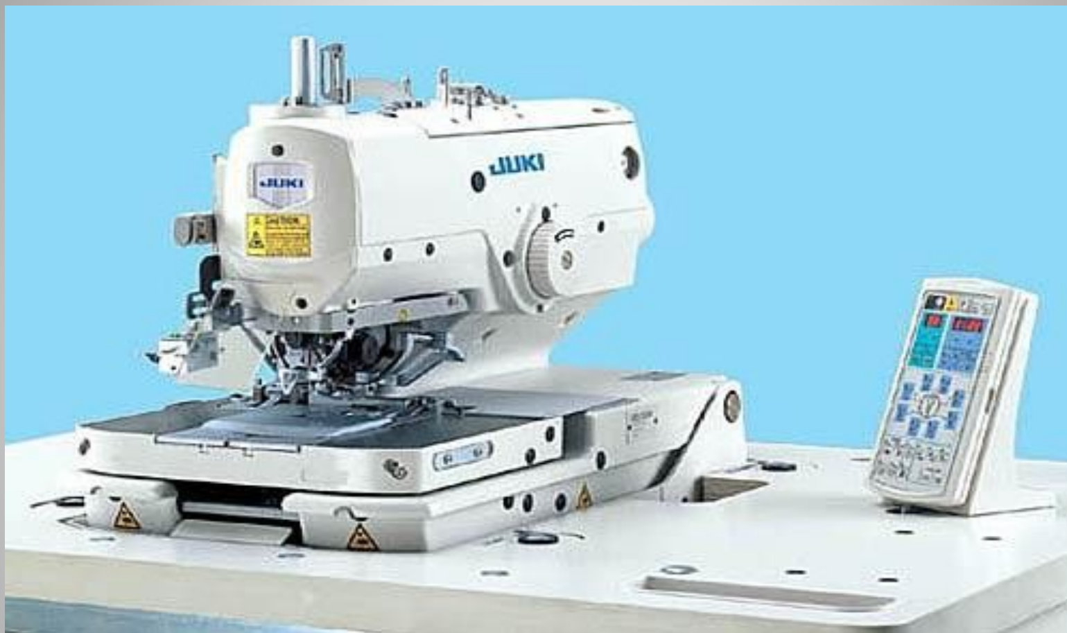
Вышивальная промышленная машина