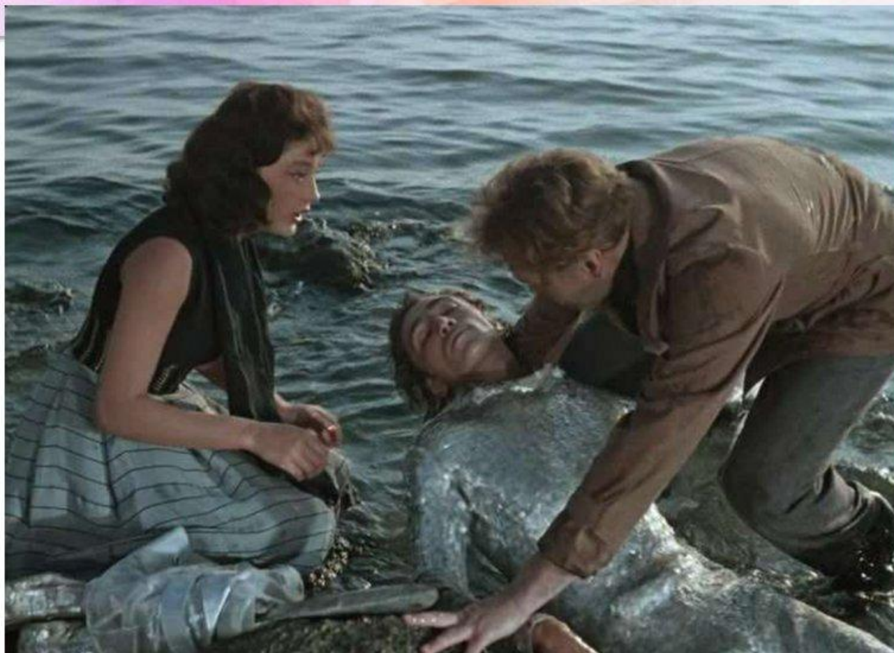
Художественное пространство фильма «Человек – амфибия»