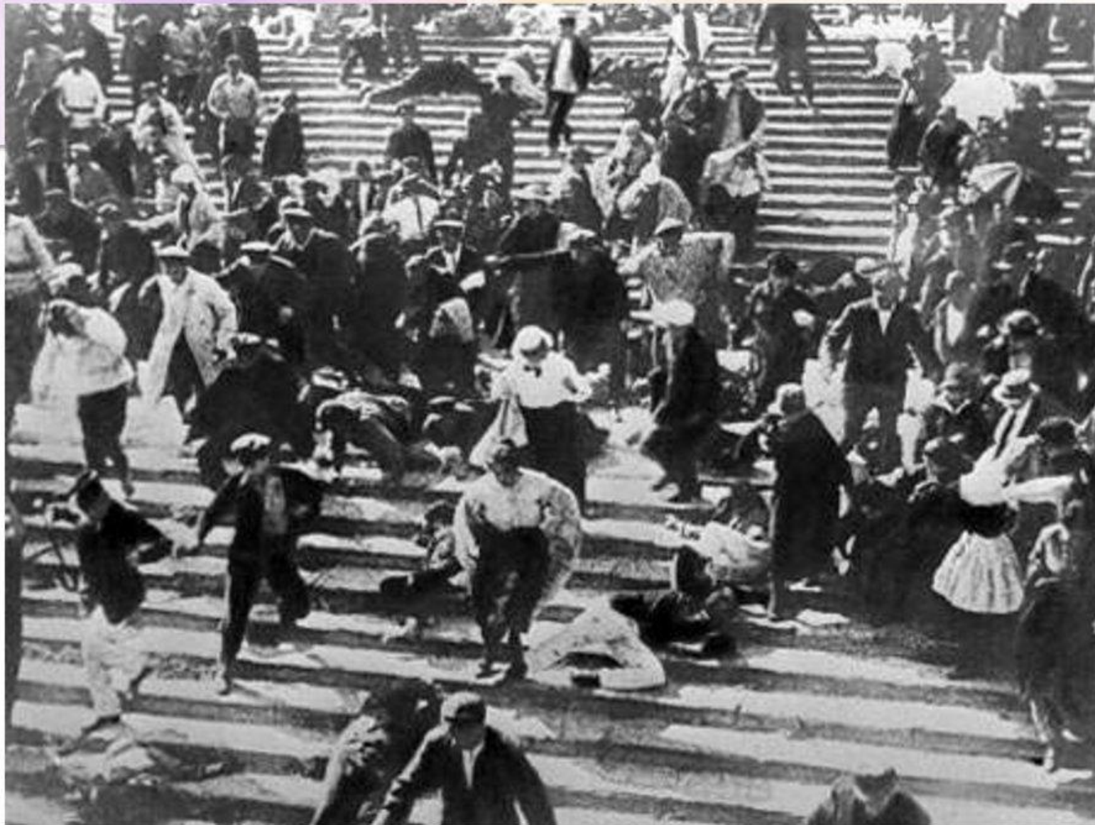
Кадр из фильма «Броненосец Потемкин»