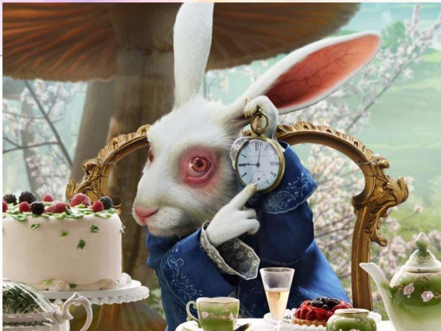
Кадр из фильма «Алиса в стране чудес»