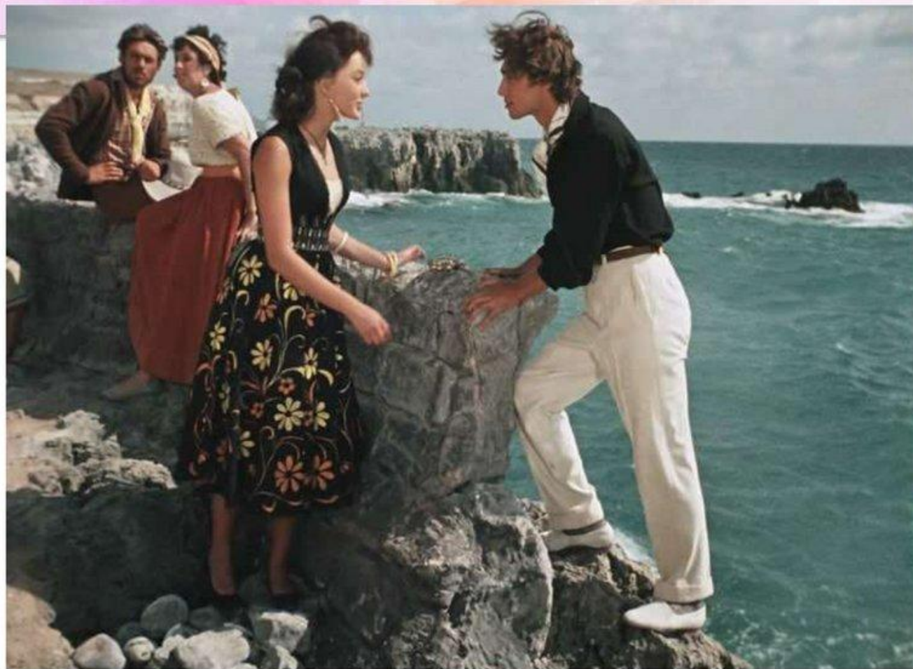
Художественное пространство фильма «Человек – амфибия»