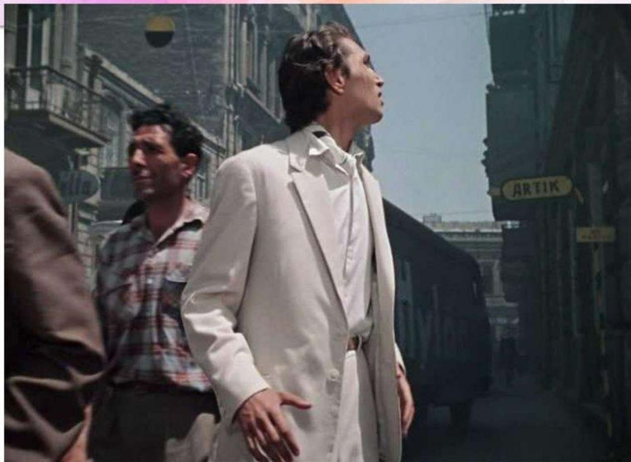
Художественное пространство фильма «Человек – амфибия»