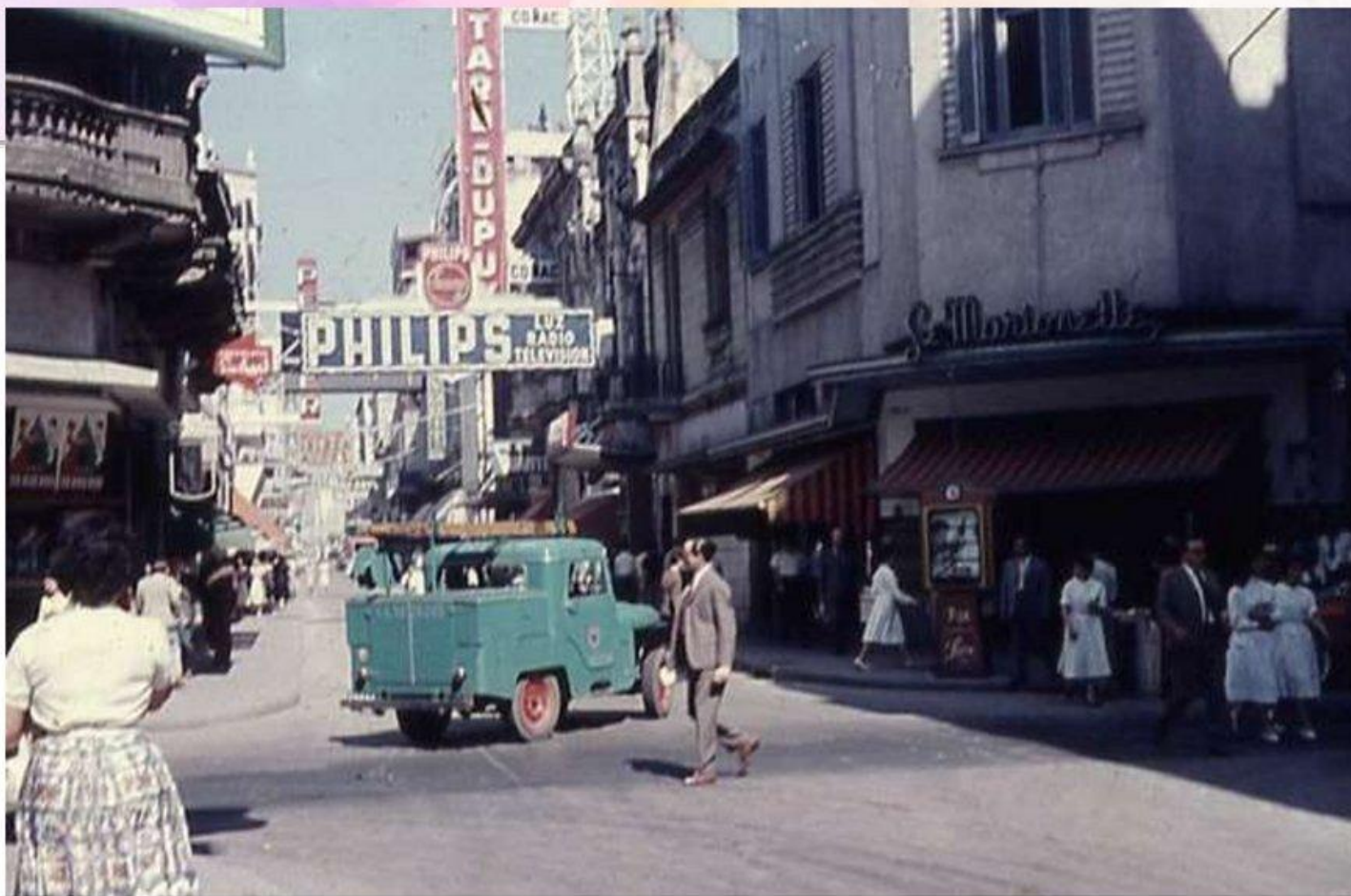
Художественное пространство фильма «Человек – амфибия»