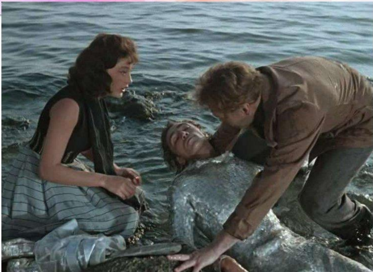
Художественное пространство фильма «Человек – амфибия»